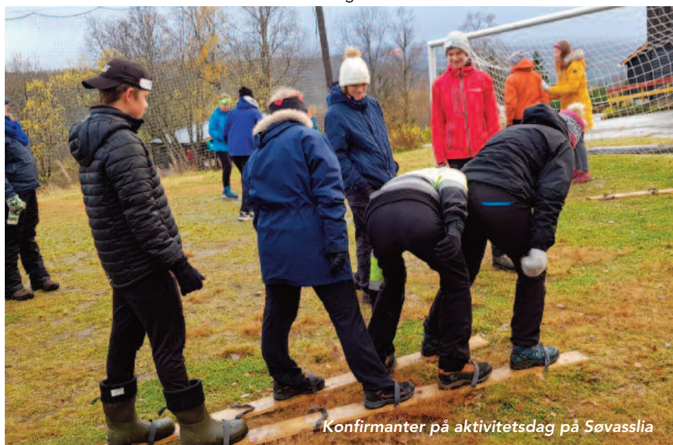
Konfirmanter på aktivitetsdag på Søvasslia