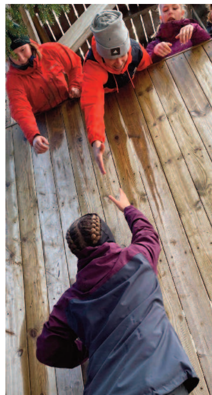
Vi har forsøkt tilrettelagt aktiviteter for konfirmantene våre gjennom hele året. Her er vi på aktivitetsdag på Søvasslia ungdomssenter.