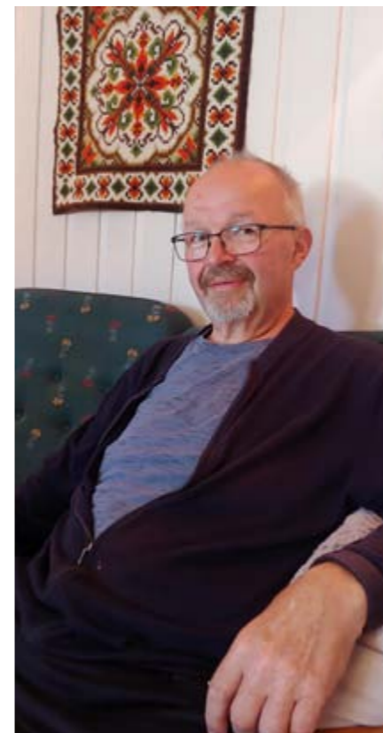
Liten pause i sofaen på grendahuset