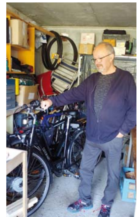
Sykelreparatør og altmuligmann

det slik. Har naboer og kompiser som har båter og hus som skal fiksast, vi hjelper kvarandre når det trengs. Treskjerer er ein hobby som for tida ligg nede. Og turer på sykkel og til fots."