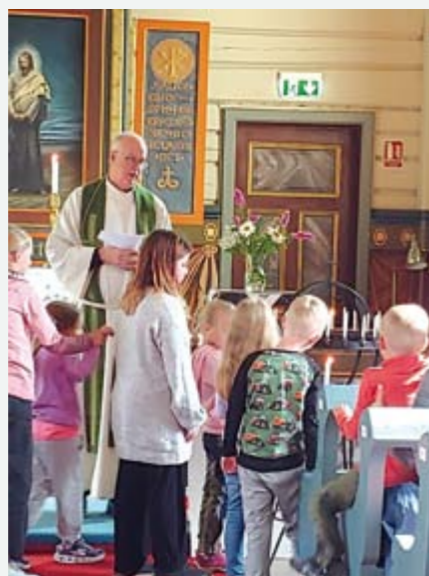
Lystenning og bønn ved lysgloben.