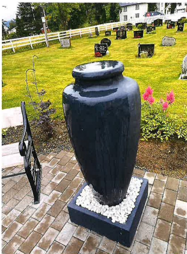
FONTENE MOE KIRKE, ORKLAND