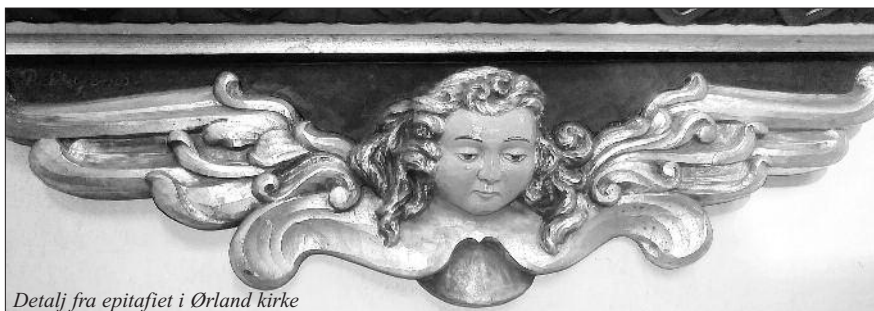
Detalj fra epitafiet i Ørland kirke