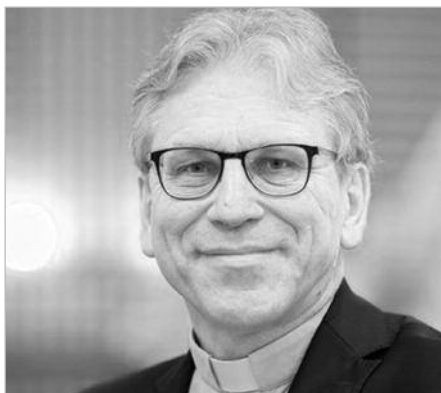
Olav Fykse Tveit

31. januar tilsatte Kirkerådet hennes etterfølger, generalsekretær i Kirkenes verdensråd Olav Fykse Tveit (59). Fykse Tveit er prest og dr.theol, og har ledet Kirkenes verdensråd i 10 år. KV organiserer 500 millioner kristne over hele verden, og har 350 medlemskirker i 110 land. Fykse Tveit er slik sett svært godt skodd for å lede bispemøtet og bidra til en god utvikling i vår kirke.