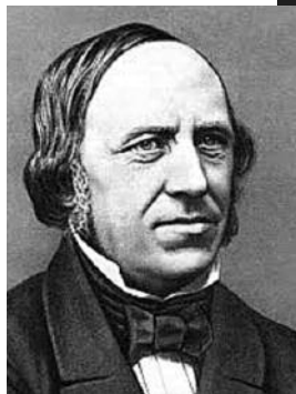
Ludvig Matias Lindeman

Melodien ble opprinnelig omkring 1860 skrevet til en salme av salmedikteren Hans A. Brorson, men kom etter hvert