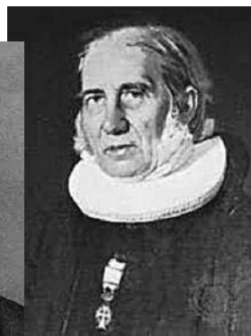
Nicolai F. S. Grundtvig