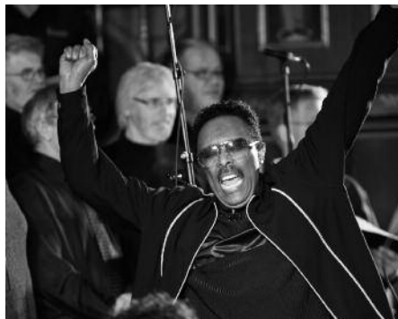
Jessy Dixon fra konserten i Jøssund kirke den 27. januar 2009.

I januar 2009 var det konsert med gospellegenden Jessie Dixon i Jøssund kirke. Dixon skrev sanger til både Natalie Cole, Diana Ross og Cher og var nominert til Grammy-pris hele sju ganger. Mest av alt var han kjent som en fantastisk gospelsanger. På konserten i Jøssund-kirka var det nesten nyetablerte Ørland Gospelkor med. Det betydde selvsagt en enorm inspirasjon for medlemmene i koret. Flere av sangene som ble fremført her er tatt med videre i korets faste repertoar. Senere ble det konsert med Calvin Bridges, også han en verdenskjent gospelsanger.