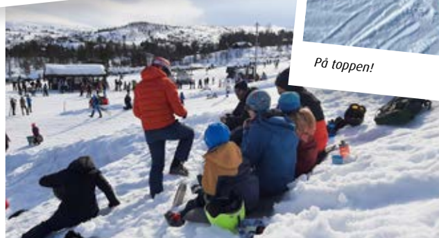
Furedalen skisenter i bakken.