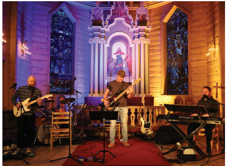
Frå solidaritetskonsert i Os kyrkje.

Vi har hatt ein orgelklubb for barn, alder 9-13. Det var to i klubben og vi møttest ein gong per måned. Dei to elevane har spelt til gudstenester både i Os og i Nore Neset kyrkjer. I haust var det ingen som meldte seg på.