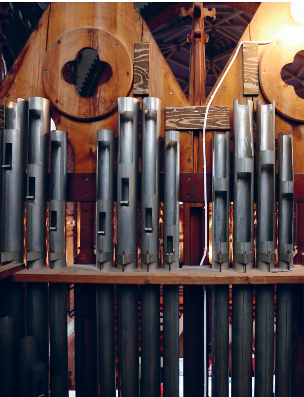
Inni orgelet i Sagene kirke.