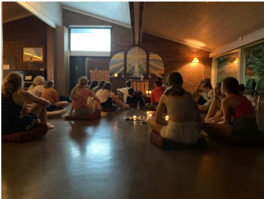
Gudstjeneste på konfirmantleir.

Pandemien preget også konfirmantarbeidet i 2021. Oppstartshelgen kunne ikke gjennomføres som planlagt. Konfirmantene fikk komme innom kirken og hente en pakke med en hilsen fra ansvarlige, samt konfirmantbibelen. Det ble også tent lys for konfirmantene. I begynnelsen ble konfirmantundervisningen gjennomført på Zoom. Etter hvert møtes konfirmantene i små grupper utendørs, avhengig av antallsbegrensingene på det gjeldende tidspunkt. Til stor glede kunne vi gjennomføre konfirmantleir i juni. Da ble gruppen delt opp i to, og hver gruppe hadde to døgn på leirstedet Sjøglimt i Ørje. Dette ble svært vellykket og konfirmantene satte stor pris på å kunne samles, være sosiale og få leirfølelsen. I august arrangerte vi temagudstjeneste, hvor konfirmantene selv laget gudstjenestene. Dette var siste samling før konfirmasjonsgudstjenestene.