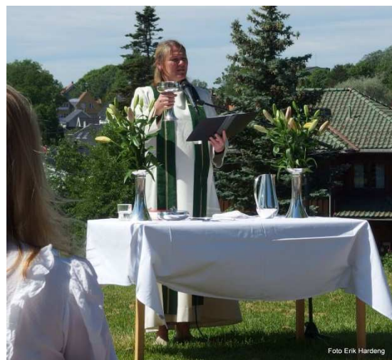
Blomstermesse utenfor Bakkehaugen kirke.

Nedgang i antall gudstjenester la seg forklare med lengere perioder med nedstenging og uten gudstjenester. Da Nordberg menighet fikk feire sine gudstjenester i Bakkehaugen kirke ble ikke nærmiljøgudstjenester feiret i Bakkehaugen. Så selv om flere gudstjenester ble holdt i Bakkehaugen kirke, vises det ikke i vår statistikk.