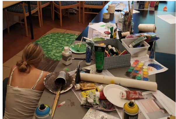
Forberedelser til konfirmantenes temagudstjeneste.

Vi har opplevd en oppgang i gudstjenestedeltakelse de siste årene, også for nattverd. 2020 og 2021 viser at tallene er tydelig preget av pandemien og mange har holdt seg hjemme. Vi kan dra nyttig erfaring av noen tiltak som ble gjennomført med gode tilbakemeldinger.