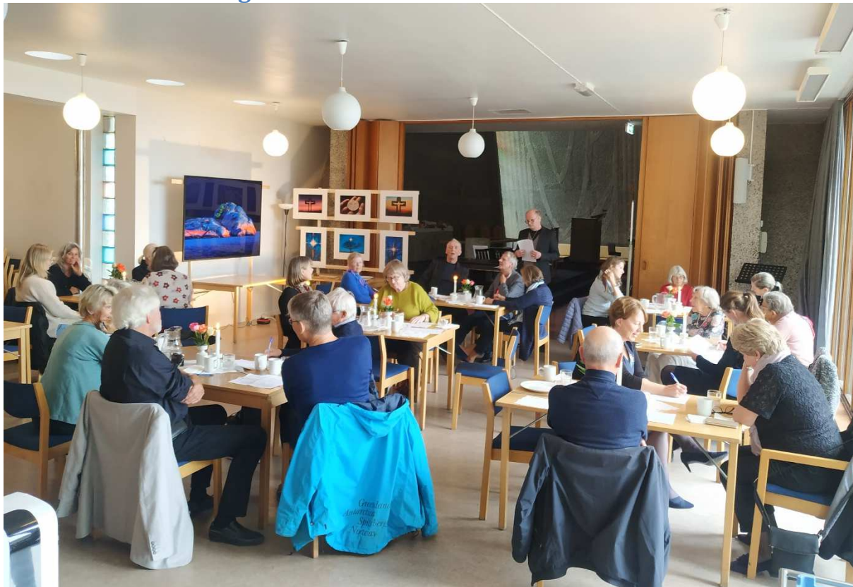
Søndag 19.9 feiret menigheten sin "Frivillighetsfest" i menighetssalen med fotografiene som rammen rundt.

I 2021 bidro ca. 85 personer som frivillige i menighetsarbeidet (frivillige korister og musikanter kommer i tillegg). Noen på fast basis, andre en gang iblant. Uten hver enkelt av disse hadde ikke menighetsarbeidet gått rundt. Selv om også dette året ble preget av flere korona-avlysninger, hadde menigheten flere arrangementer og samlinger for frivillige: