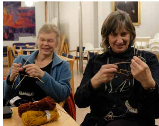
Hobby og strikking på hobby- og strikkekafe.