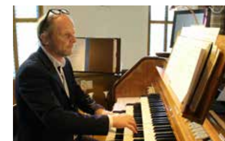
Orgelresitasjon i Vestre Aker på Allehelgenssøndag 1. november.