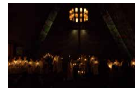
Lysmesse i Bakkehaugen 20. desember.