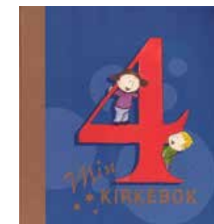
Utdeling av 4-årsbok i Vestre Aker 11. oktober og i Bakkehaugen 18. oktober.