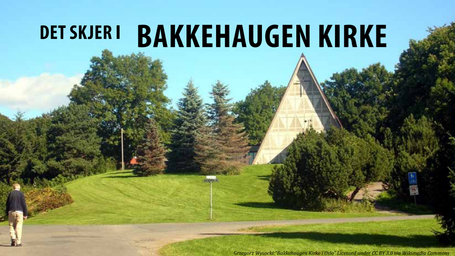
"Bakkehaugen Kirke i Oslo"