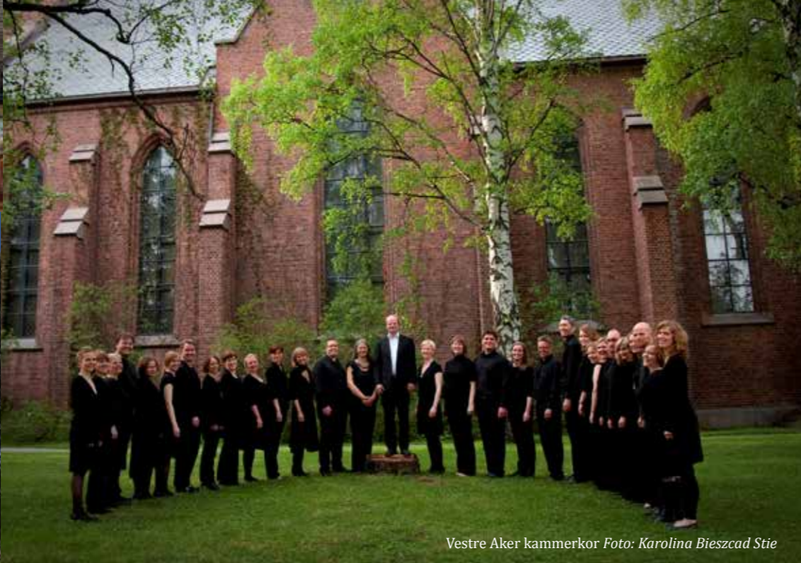
Vestre Aker kammerkor