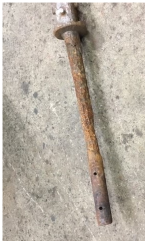
1 jern under kulen

Blyet som sannsynligvis var under kulen var blitt spist opp av kopperet, og kopperet hadde dermed begynt å tære på jernet. Jernet skal nå styrkes, spiret sandblåses og blåneres. Det skal også gjøres arbeid på kopperrosene. Nytt bly under kulen skal på plass. Kun det som må erstattes, blir erstattet med nytt (eks. enkelte av rosene).