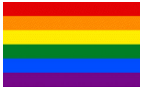
Regnbueflagget med seks striper slik vi kjenner det best i dag.