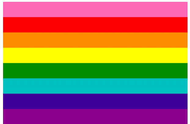
Det originale åttestripete flagget - designet av Gilbert Baker i 1978.

Rosa for seksualitet, rød for liv, oransje for helbredelse, gul for sollys, grønn for natur, turkis for magi/kunst, indigo for ro/harmoni lilla for ånd.