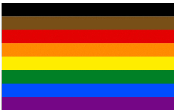
Philadelphia pride flagg (2017).

I juni 2017 vedtok byen Philadelphia en revidert versjon av regnbueflagget designet av markedsføringsfirmaet Tierney, som legger til svarte og brune striper på toppen av standard seks-farget flagg, for å rette oppmerksomhet til spørsmål om fargede personer i LHBT-samfunnet.