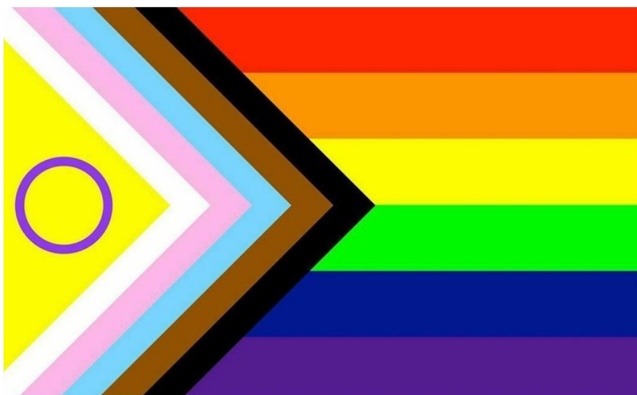
Inclusive Progress pride flagg (2021).

* Intersex betegner en person som er født med kjønnskjenntegn som enten ved fødselen, eller senere i den kjønnslige utviklingen, ikke samsvarer med verken mannlig eller kvinnelig kjønn. Det vil si at personen ikke uten videre kan beskrives som gutt eller jente ved fødselen.