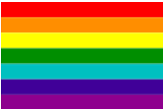
Rosa ble fjernet pga. problemer i produksjonen av flagget. (1978 - 79)

Allerede i 1979 ble det opprinnelige designet endret, ettersom det var mangel av det stoffet den rosa stripen ble laget av. Og videre ble fargene turkis og indigo slått sammen til kongeblå. Denne reviderte utgaven av regnbueflagget med seks striper er det flagget vi oftest refererer til når vi snakker om regnbue- eller prideflagg i dag.