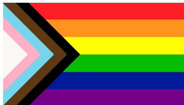
Progress pride flagg (2018).