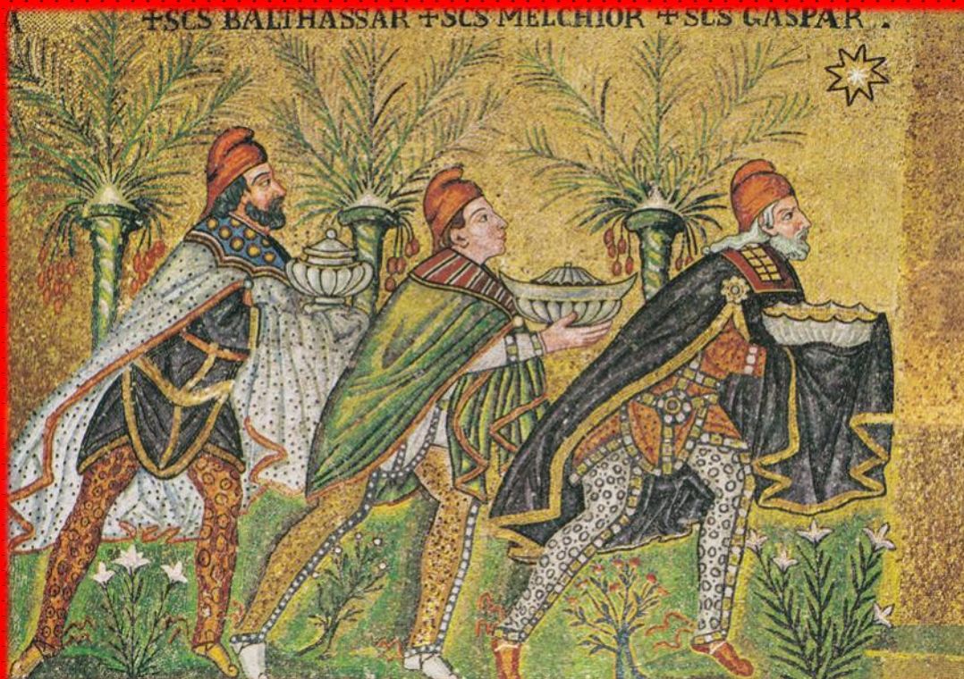
De tre vise menn Mosaikk i Basilica di sant'Apollinare nuovo, Ravenna