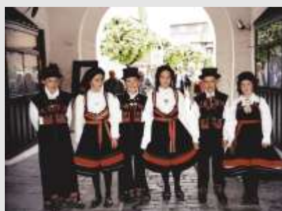
Folkemuseets dansegruppe s. 8