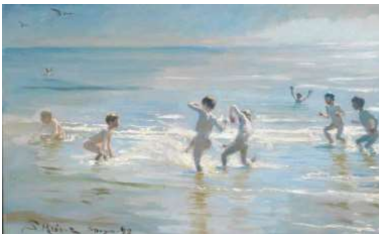
En Flok Drenge ude i det solglitrende vand, Peder Krøyer 1892

Tekst: Astrid Lindgren Gjendiktet av: Halldis Moren Vesaas