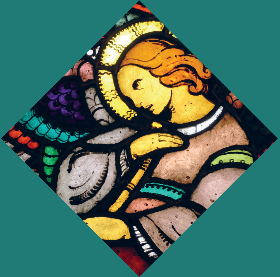
Detalj fra Per Vigelands glassmalerier