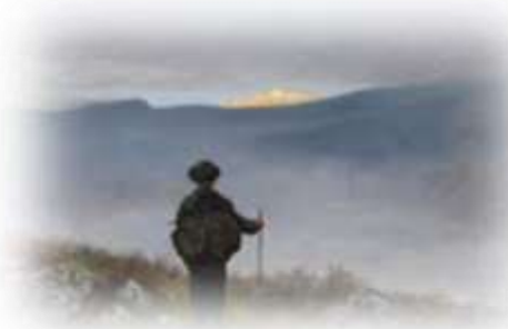
Th. Kittelsen, Soria Moria

Velkommen som konfirmant i Bygdøy menighet!