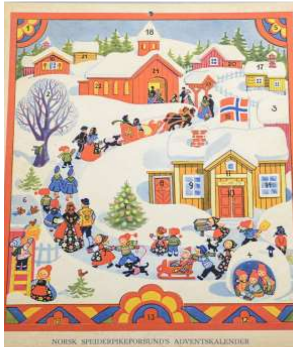
Norsk Julekalender fra Trøndelag Folkemuseum

Senere har julekalenderne utviklet seg og nå er det mer og mer vanlig med en liten gave hver dag.