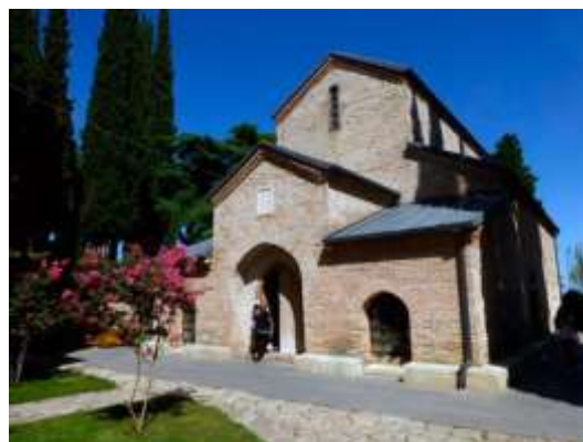
Bodbe kloster ved Sighnagi Kakheti.

Etter at dette var oppnådd, skal Nino ha trukket seg tilbake til foten av et fjell i Bodbe i Kakheti, hvor hun døde rundt år 330 og ble gravlagt. Over graven ble det bygd en kirke.