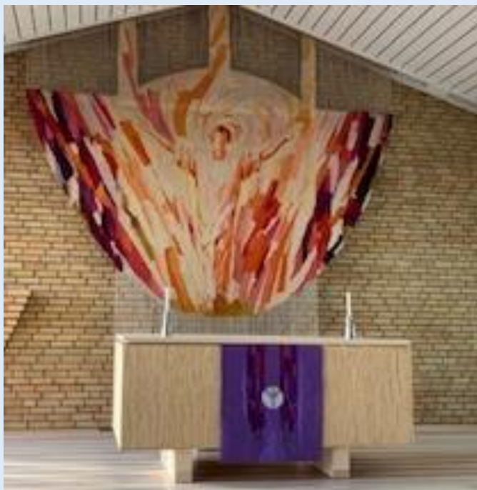
Nytt fiolett alterklede.