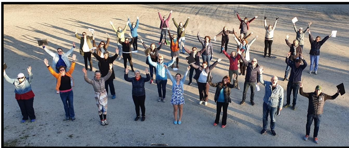
Utendørsøvelse på idrettsplassen