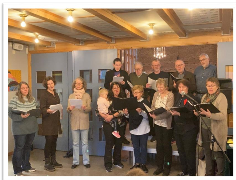
En gruppe fra Prinsdal Sangeri sang på «Smaken av jul»