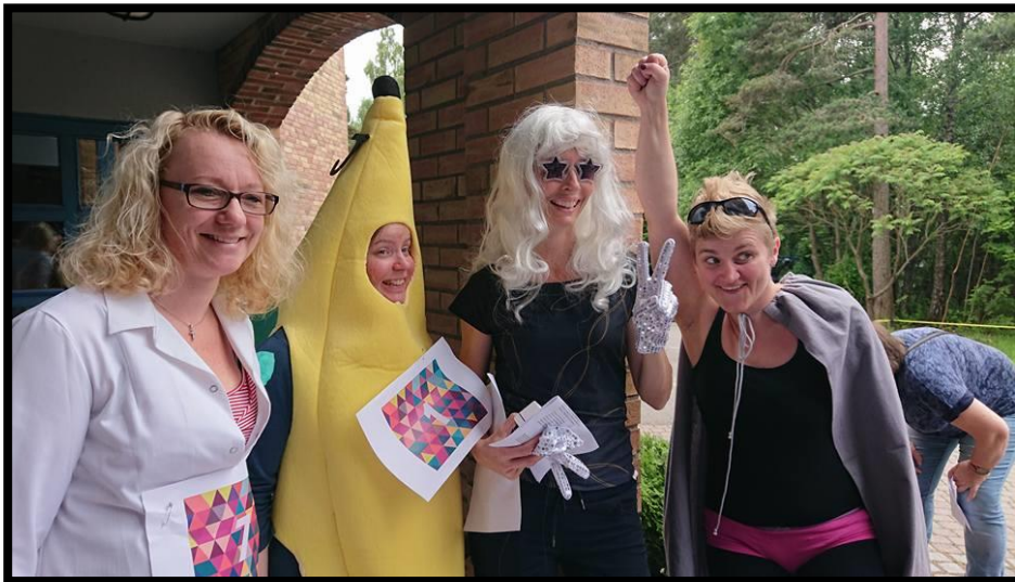
Bilde fra globalløpet i juni, 4 fra staben tok oppgaven svært alvorlig og løp for penger!