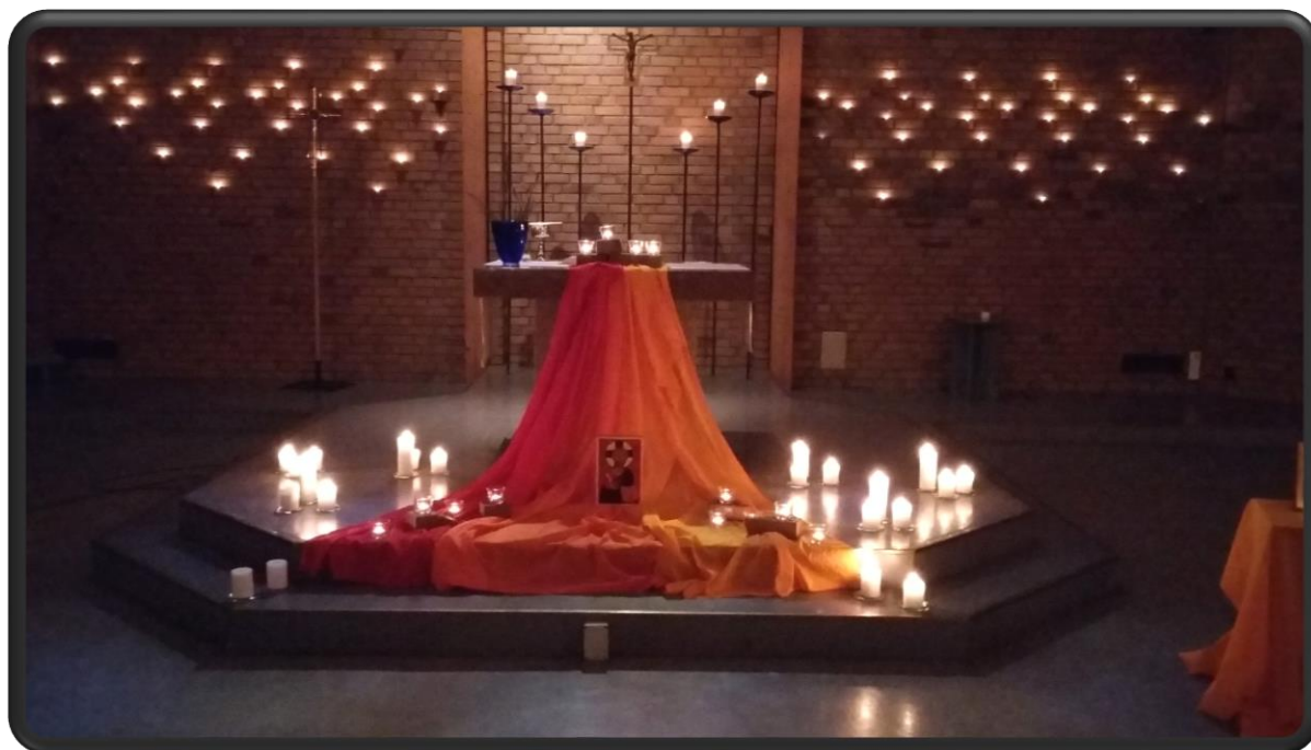
Bilde fra Taize-gudstjenesten

Prinsdal Sangeri har stilt opp, enten hele eller deler av koret, på flere gudstjenester gjennom året, under ledelse av kantor. Dette er en berikende ordning som hever det musikalske arbeidet med gudstjenestene. Sjubbolet ten-sing og HP Kluzz har også deltatt med sang på gudstjenester i løpet av året. I tillegg er det også en fin gruppe som stiller opp som forsangere på gudstjenester ved behov. Det har også deltatt solister og instrumentalister på gudstjenester i løpet av året, både profesjonelle og frivillige, gjerne i forbindelse med høytidsdager eller gudstjenester med spesielt musikalsk preg. I løpet av året har menigheten flere gudstjenester med et spesielt musikalsk fokus, for eksempel folketonemesse, blues- og bønnedag og Taize-gudstjeneste. Kantor har også ansvaret for «Vi synger julen inn» som fant sted 18. desember, med medvirking fra Prinsdal skolekorps, Prinsdal skolekor og Sjubbolet. Det tradisjonsrike arrangementet samlet rundt 250 mennesker og er en fin måte å samle folk fra hele lokalmiljøet.