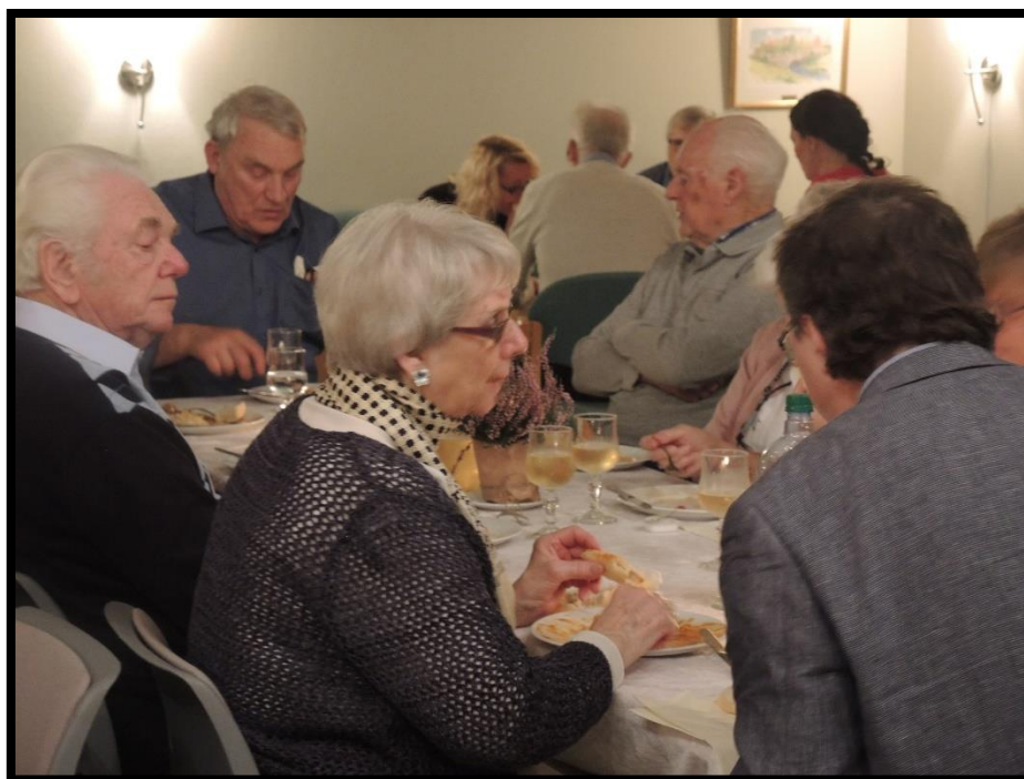
Samtale ved måltidet