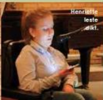
Henriette leste dikt.