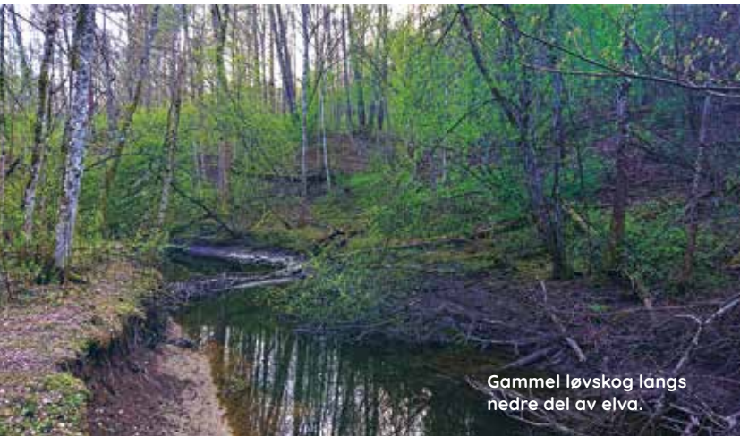
Gammel løvskog langs nedre del av elva.

Vårmorgen, solglitter mellom trærne, tidlig, litt ør etter natta, stille. Viker av fra gata, følger en liten parkvei nedover. En vegg av løv og grønske møter, går gjennom sløret og er plutselig inne i en egen verden. Skygge, søylehall, trær store små i virvar, vann som bruser, foss, fuglekvitter, fløytende toner, hamringer fra sterke nebb, en symfoni av lyder, et orkester av røster fra krattet og fra høyt under løvtaket. Ljanselva, en vårmorgen.