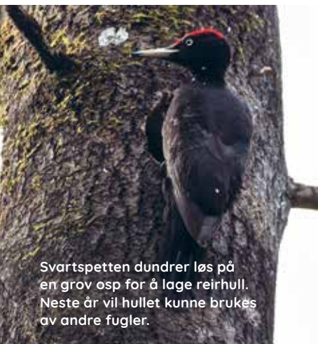
Svartspetten dundrer løs på en grov osp for å lage reirhull. Neste år vil hullet kunne brukes av andre fugler.

Ljanselvas blågrønne korridor av rik natur fra marka til fjorden har en viktig funksjon både som leveområde og korridor for dyr og planter og som rekreasjonsområde for folk fra to bydeler.