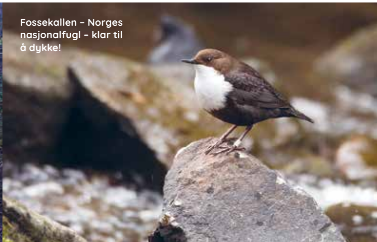
Fossekalen – Norges nasjonalfugl – klar til å dykke!