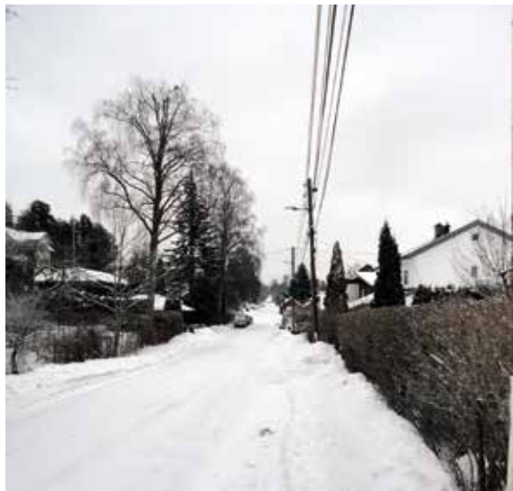
Øvre Prinsdals vei, nordre del, i dag en ren boligvei. Øvre Prinsdals nord for Hauketo skole er i dag en ren boligvei. Det er ikke mye her som minner om at den en gang var hovedveien sørover fra Oslo.