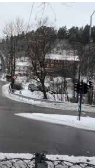
anselva ved Ljabru hovedgård kgrunnen. Bildet er tatt fra rart bakken i bakgrunnen fikk