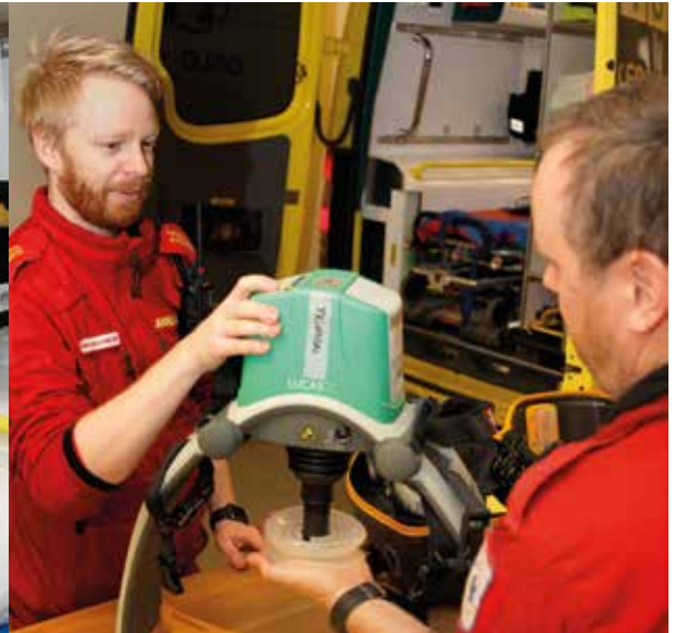
Bilen er 100% komplett utstyrmessig.