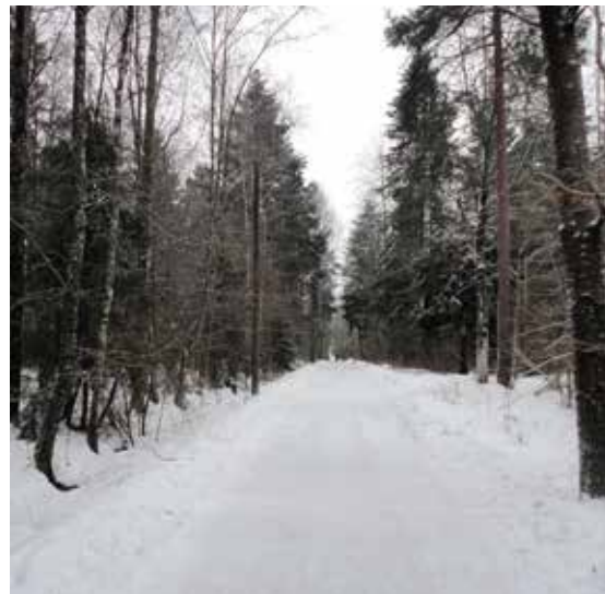
Kongeveien sør for Øvre Prinsdal gård. På denne strekningen, som ikke har noen adresser, får en følelsen av å være på «Den Frederikshaldske Kongevei».

vei. Før 1956 ble veien på denne streknin- gen bare kalt Prinsdalsveien.