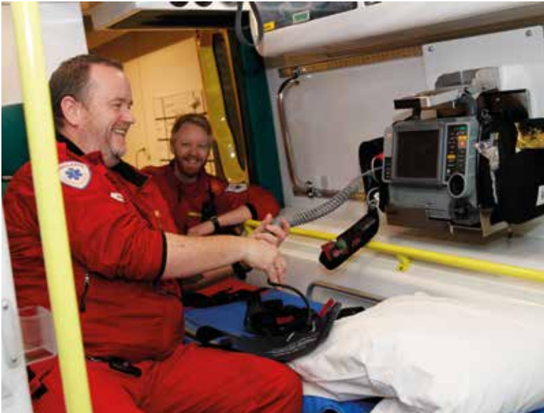
Prinsdal er statistisk sett en av de travleste ambulansestasjonene i landet.