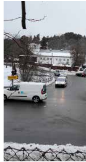
Ljabruveien med broen over Ljanselva til venstre og Ljabrubakken i bakgrunnen. Her ligger den gamle «Hauketo Kro». Ikke alle kjenner tilnavnet «Mærrapina».