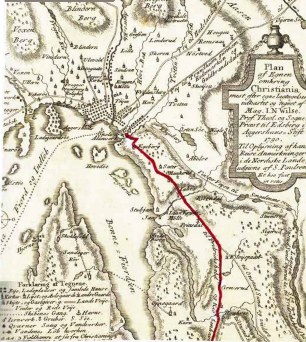
◀ Gammelt kart over Den Frederikshaldske Kongevei. «Plan af Egnen omkring Christiania mest efter egne lagtagelser, udkastet og tegnet af Mag. I. N. Wilse» fra 1790. Selv om geografien er nokså omtrentlig på dette kartet, gir det et godt inntrykk av hovedveiene til/fra Oslo. Den Frederikshaldske Kongevei er tegnet inn med rødt.