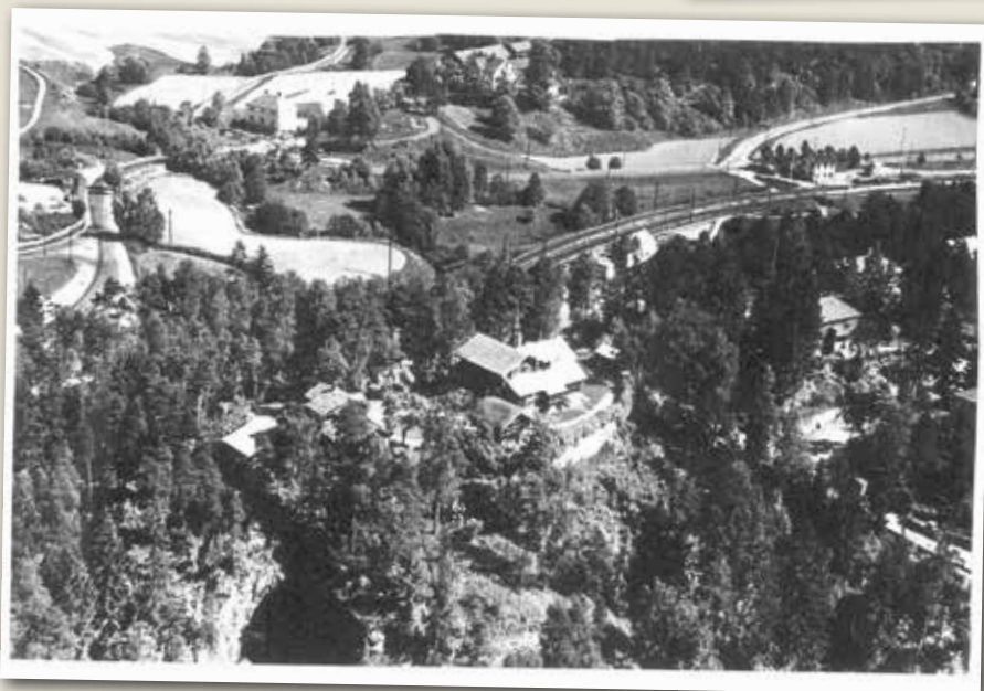
Dette er fra ca. 1950, og vi ser Hauketo stasjon til høyre, og «Kroa» til venstre. Hauketo gård midt på øverst, og i forgrunnen stedet «Sole» på Ljanskollen.