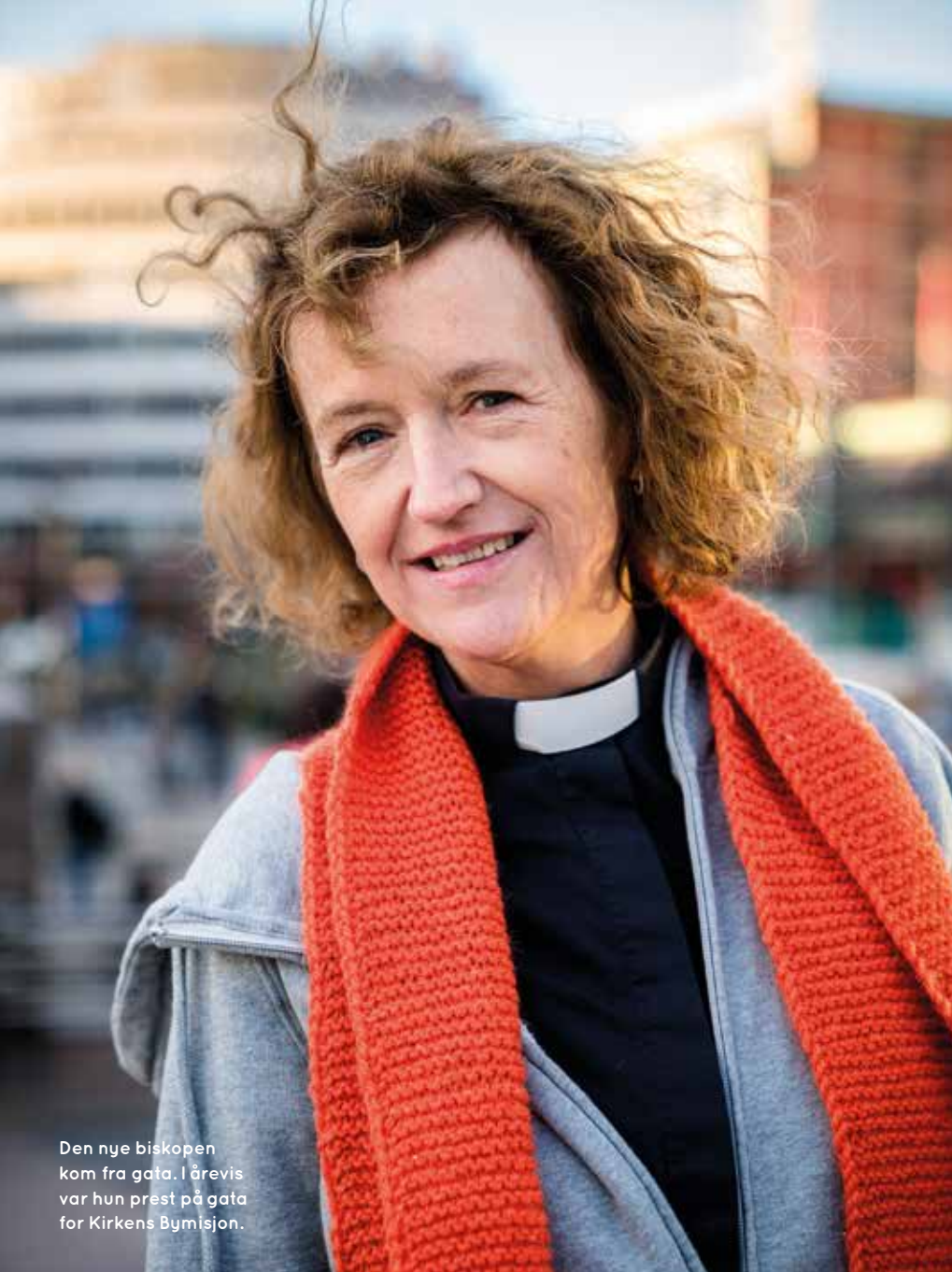
Den nye biskopen kom fra gata. I årevis var hun prest på gata for Kirkens Bymisjon.