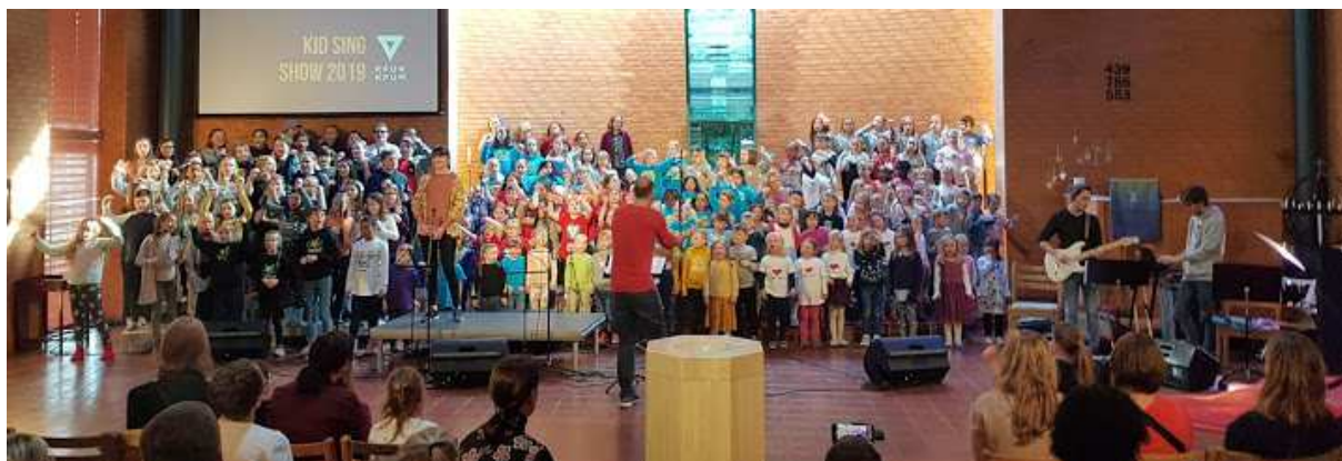
Kid Sing Show samlet mange

Vi arrangerte for første gang vår egen festival i fastetida. Konserter, gudstjenester, utstilling og temakvelder utgjorde den nye RUACH-festivalen (Ruach er hebraisk for pust, ånd, vind). Høydepunkter var konserter med Ole Paus, vokalgruppen Pust, Garness og Kid Sing Show (med 200 KFUK-KFUM barn). Vi erfarer at mange setter pris på kulturtilbud lokalt, og kommer på konserter og andre arrangementer. Festivalen ble derfor i 2020 videreført og videreutviklet med navnet Pulsfestivalen.