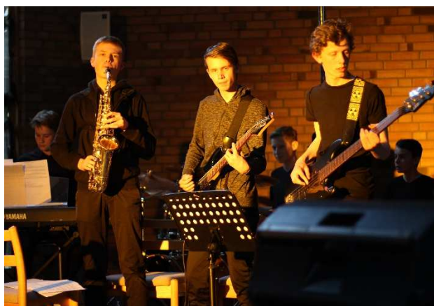
HåPe Revy 2019