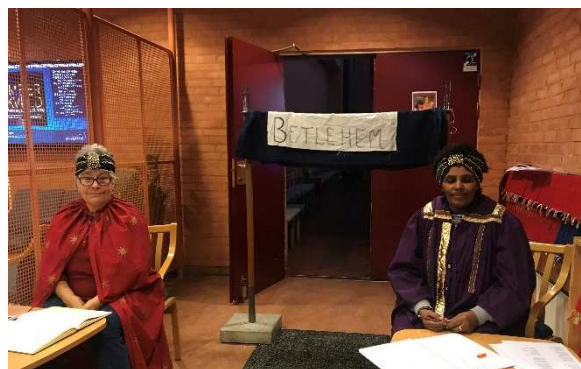
Frivillige er tellekoner når barnehagene kommer på besøk.

Alle 4 barneskoler og ungdomsskolen på Holmlia har egne skolegudstjenester før jul. Vi opplever godt samarbeid med skolene.