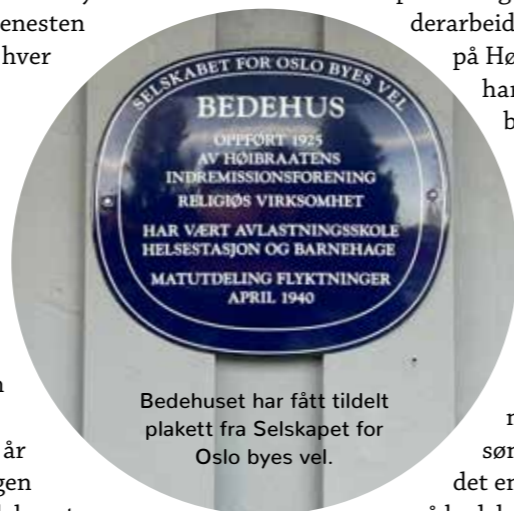
Bedehuset har fått tildelt plakett fra Selskapet for Oslo byes vel.

på onsdager og et på søndag kveld, de senere årene har det vært et ukentlig møte på torsdager. Helt siden speiderarbeidets første start på Høybråten i 1932 har speiderne hatt bedehuset som et fast tilholdssted. En rekke kor i menigheten og foreningen har opp gjennom årene brukt huset som øvingslokale. I mange år hadde søndagsskolearbeidet en sentral plass på bedehuset. Det samme gjelder annet barne- og ungdomsarbeid. I dag drives ungdomsklubben