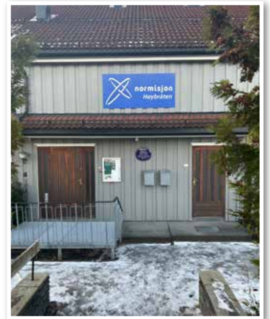
Inngangspartiet. Hovedinngang til venstre. Inngang til bestyrer- og vaktmesterleilighetene til høyre.