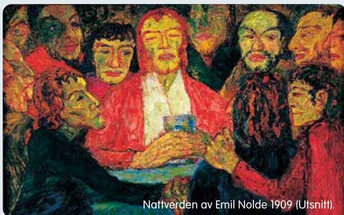
Nattverden av Emil Nolde 1909 (Utsnitt).

Det er tider med mye mediastøy og uro i verden. Samtidig synes pandemien å roe seg og vi er på vei mot påsken. Da kan det være godt, alene og sammen med andre, å ta tid til å møte Jesus i stillhet og ettertanke gjennom bilder og tekster.