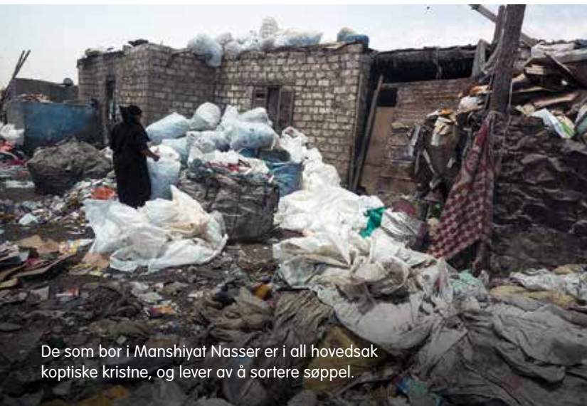
De som bor i Manshiyat Nasser er i all hovedsak koptiske kristne, og lever av å sortere søppel.