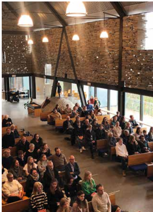
«Dette arkitekturverket er samling av vanlige materialer som det er blåst liv i på en til da ukjent måte ved en uvanlig, original sammenstilling i rommet», skrev Einar Dahle og Jiri Havran i bind 6 av «Kirker i Norge» (2008).