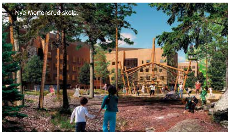
Nye Mortensrud skole.