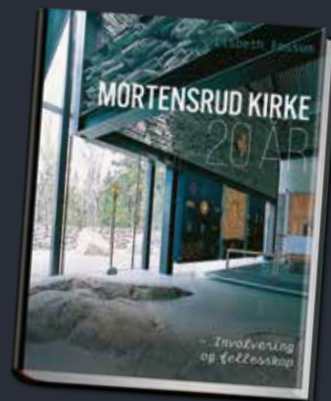
Utkast til omslaget.