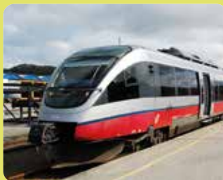
Peir Smerkl, Wikipedia