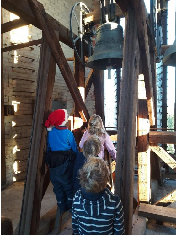
Opp i tårnet! Tårntur er populært når 1-klassingene kommer på kirkebesøk før jul. De får også prøve hvordan det er å ringe med kirkeklokka.

2. klassene inviteres til påskevandring.