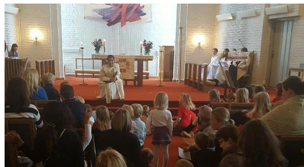
lydhøre og interesserte barn i en gudstjeneste for små og store