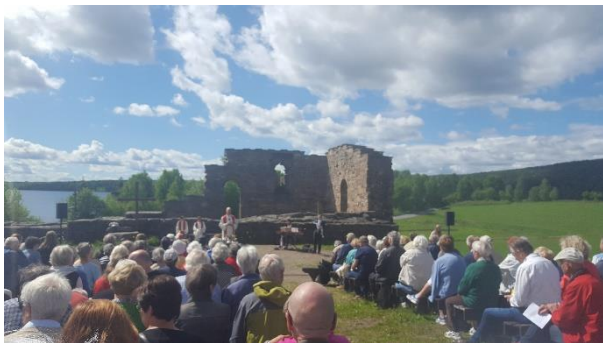
2.pinsedag er det hvert år prostigudstjeneste i Maridalsruinene. Dette samler folk fra hele Vestre Aker prosti.

GSS knytter gjerne an til trosopplæringen (se under «Trosopplæring»).