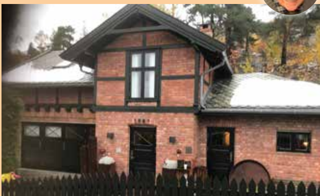
Uthusbygningen på Nordstrand politistasjon med arrestlokale til høyre og vognskjul/garasje til venstre.