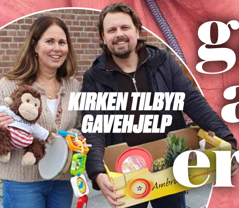
KIRKEN TILBYR GAVEHJELP