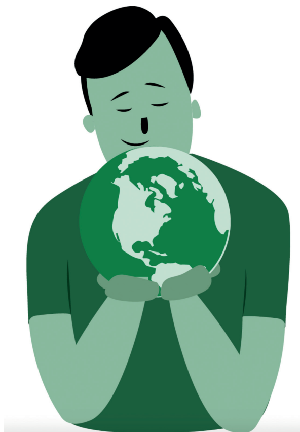
Ill. av Mari Kvale, fra Bærekraftsboka , til FN's bærekraftsmål nr. 13: Stoppe klimaendringene

«Verden er mer enn et problem som skal løses, den er et gledens mysterium som vi skal betrakte med glad lovprisning.»