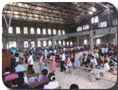
Manglende tak stopper ikke en gudstjenestefeiring

Og som bildet viser, hverken tidevann eller annet er en hindring når man skal ut å besøke en landsby. Bildet viser 4 av personalet fra Shalom på vei til Ankelilaly. De måtte gå i ca. 3,5 time på denne våte veien mens bagasjen deres ble kjørt i forveien med en oksekjerre. Men det skal mer til enn våte veier for å ødelegge humøret til denne gjengen.