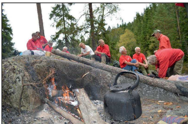
Kaffepause rundt bålet.

Vi, som ofte har berga tørrskodd over ei klopp de har lagt over ei vasstrukken myr, sier tusen takk for innsatsen!