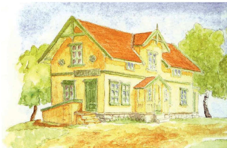
Bildetekst: Oppsal gård – den høytliggende gården - for ombyggingen. Utsnitt fra akvarell av Ivar Håkenstad (1997). Flere bilder på: http://bildebaser.deicno og søk Oppsal gård.