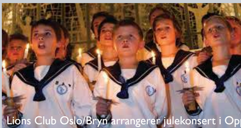
Lions Club Oslo/Bryn arrangerer julekonsert i Oppsal kirke