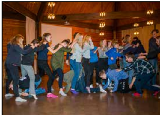
Årets konfirmanter i aksjon

Vi i menighetsbladet skal naturligvis følge fortsettelsen med argusøyne. Det venter undervisningssamlinger, leir og høy frekvens av relasjonsbygging. Det skal også arrangeres en kveldsturnering i Oppsal Arena 13. mai, som er åpen for alle ungdommer. Vi gleder oss til fortsettelsen.