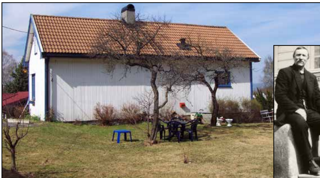
Den tidligere husmannsplassen Kroken i Skøyenkroken 4 slik våningshuset så ut i 2003. Alfred Petersen innfelt med et bilde (utsnitt) fra ca. 1925. Se Østensjø lokalhistoriske bilder: http://bildebaser.deichman.no/ .

Alfred jobbet i over 50 år på Søndre Skøyen, fra 1895 til 1946. Kroken ble frikjøpt i 1944. Låven ble revet omkring 1967/68, men våningshuset står fremdeles med adresse Skøyenkroken 4. Alfred døde i 1966, 90 år gammel.