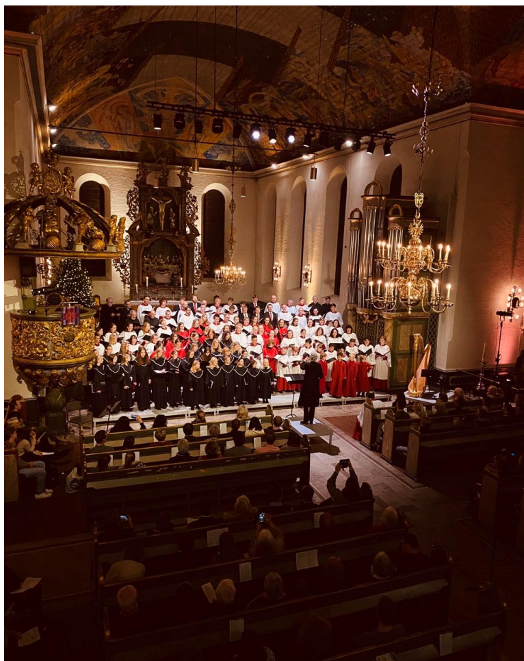
Bilde fra den årlige julekonserten Klinge skal et jubelkor