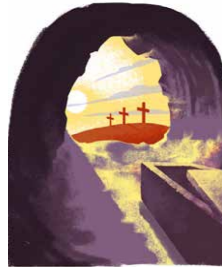
På Påskemorgen var Jesu grav tom.

Langfredagsmørket kunne likevel ikke vare ved. Det som ikke kunne tolkes som annet enn dødens sikre triumf, det ser Kingo som Guds seier over alle ondskapsmakter, et oppgjør en gang for alle med alt som står imot. Ved dag gry på den andre siden av sabbatshelgen er Jesu grav tom.