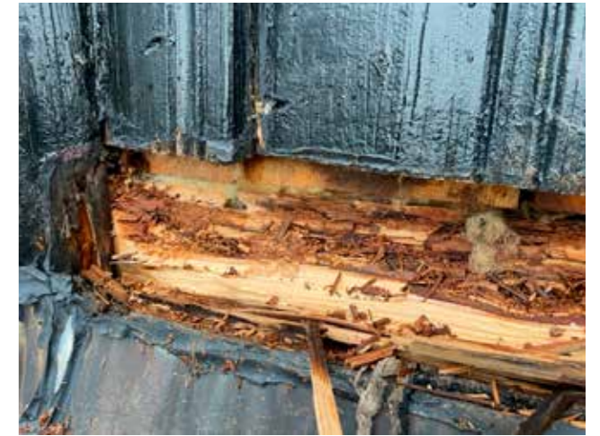
Eksempel på råteskade.