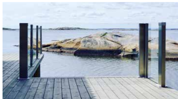
Større stolpeavstand, bredere glassflater.

Våre design leveres som rekkverk, leegger og gjerder som bygges etter behov og ønsket design.