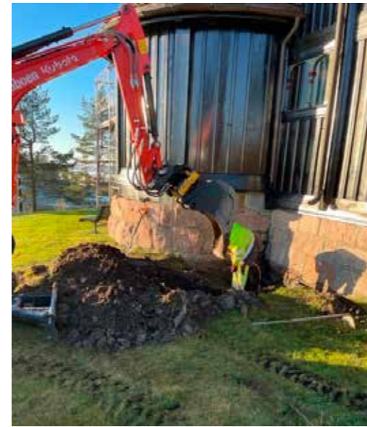
Fra dreneringsarbeidene i høst

Vi har hele veien hatt med oss konsulentfirmaet OPAK. De kom nå i slutten av januar med en rapport som foreslo å bytte alle vinduene, utbedre alle råtepunktene i kledningen, rette opp setningsskader i glassbyggersteinen i kjelleren og legge beslag på en rekke steder i konstruksjonen, slik at vannet ledes vekk. Arbeidet med å rette opp glassbyggersteinen i kjelleren pågår nå i vinter.