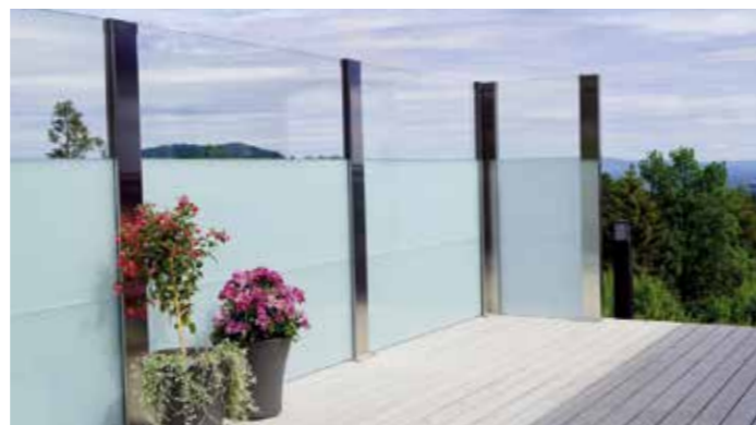
Glass og øvrige elementer innfestes inn i stolpene – bedre estetikk, lunere miljø og støydemping.

Våre design leveres som rekkverk, leegger og gjerder.