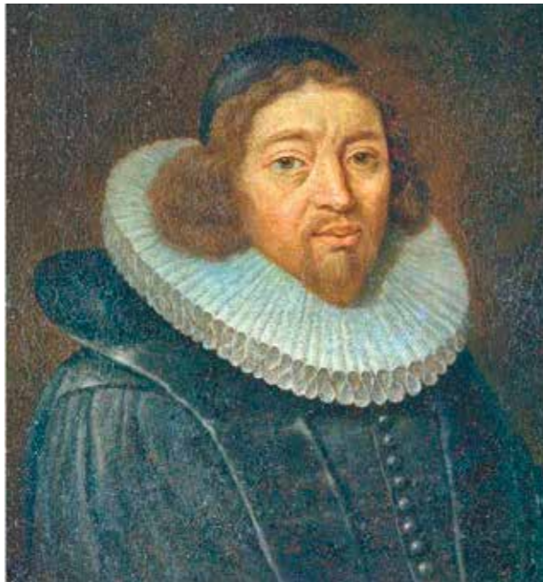
Den danske salmedikteren Thomas Kingo (1634–1703) er representert med 16 salmer i Norsk salmebok 2013. Kingo kalles også «påskens salmedikter».