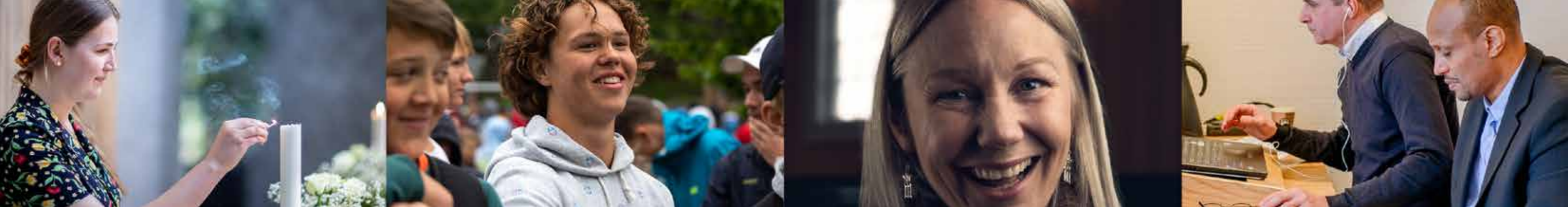
Frivillige medarbeidere trengs i alle deler av kirkens virksomhet.