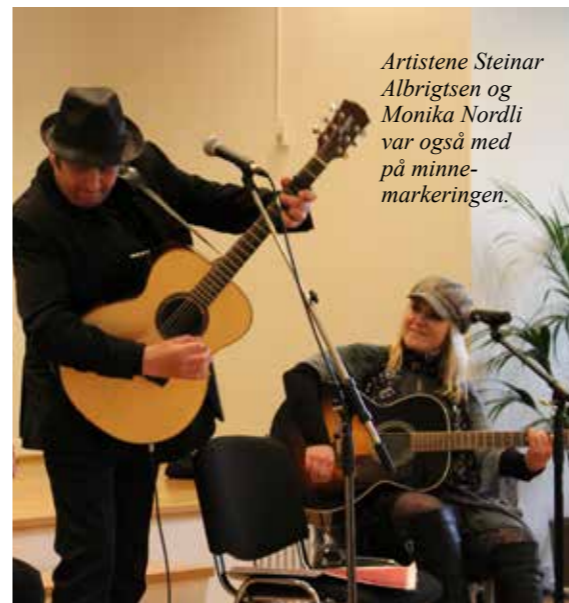
Artistene Steinar Albrigtsen og Monika Nordli var også med på minnemarkeringen.