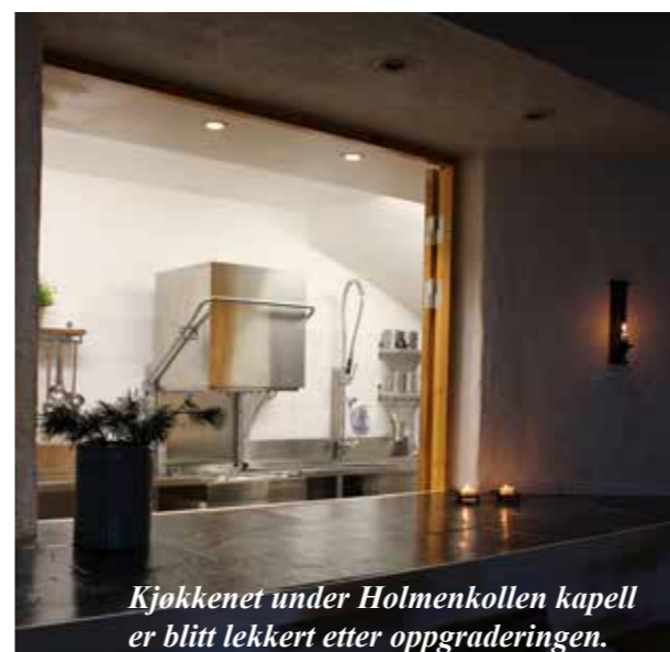
Kjøkkenet under Holmenkollen kapell er blitt lekkert etter oppgraderingen.