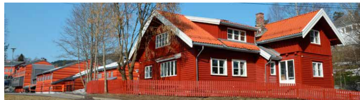
Under: Nedre Svendstuen anno 2018 med Svendstuen skole i bakgrunnen - der hvor sagbruket engang lå.