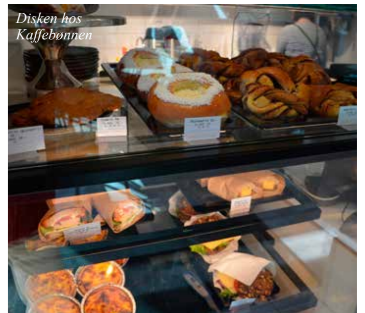
Disken hos Kaffebonnen