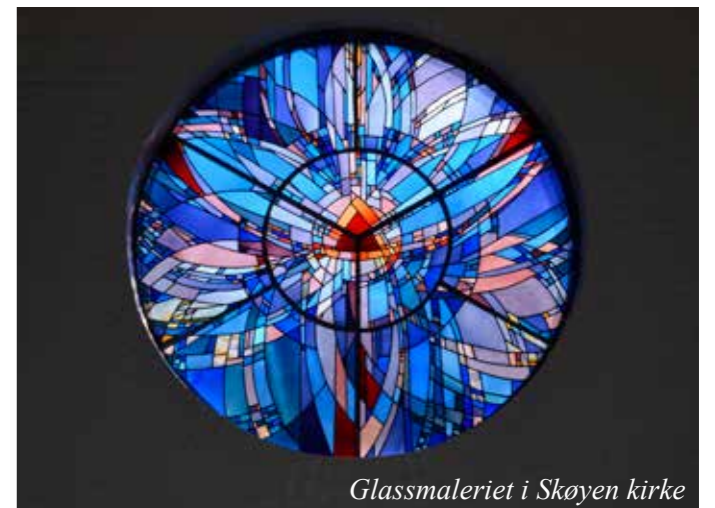
Glassmaleriet i Skøyen kirke