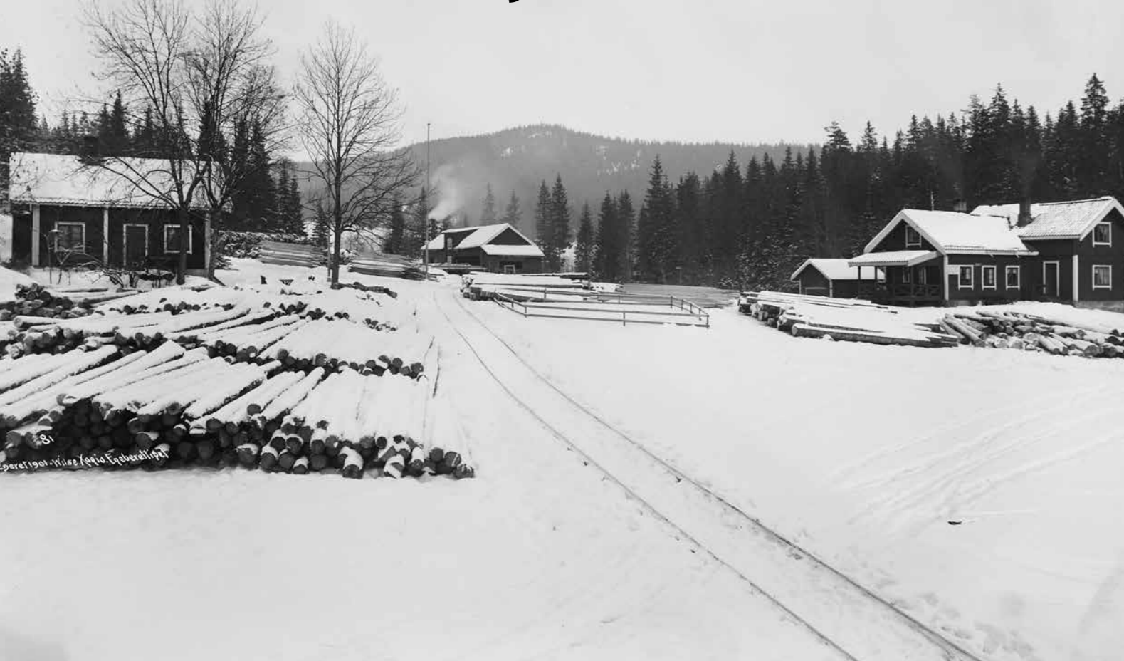
Svendstuen med sagbruket i bakgrunnen.

Svendstuen er opprinnelig en husmannsplass innunder gården Østre Holmen – gården som kan spores helt tilbake til et gavebrev fra 1376 hvor Holmen gård blir forært til Hovedøyas kloster.