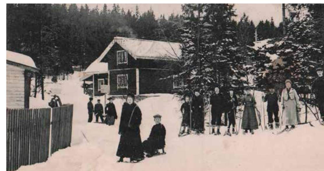
Over og til venstre: Stemningsbilder fra Nedre Svendstuen i forbindelse med forfriskende ski- og aketurer i herlige Nordmarka rundt 1913.