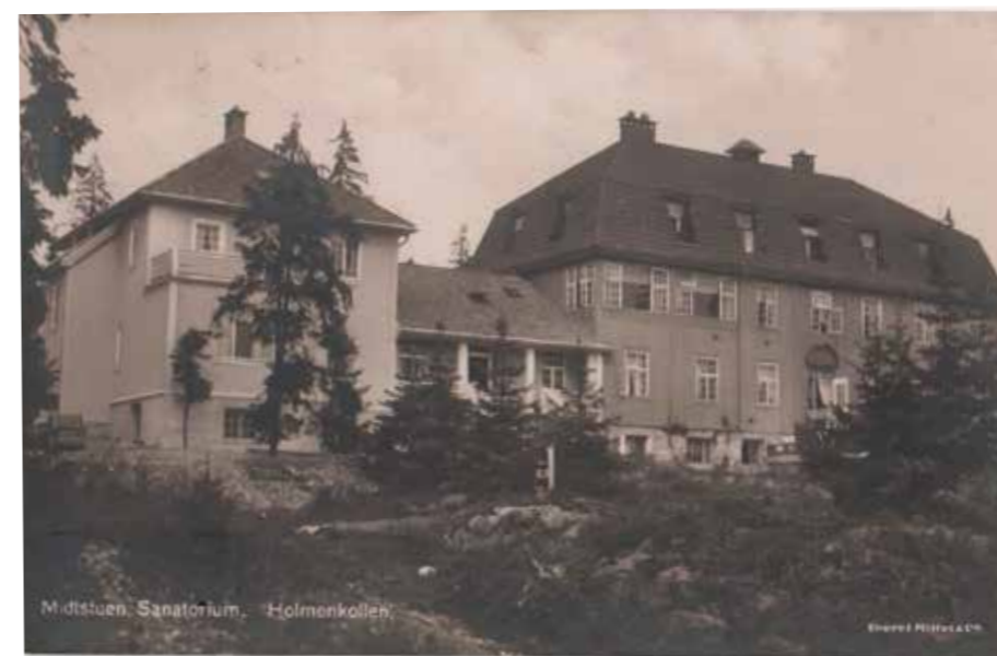
Midtstuen Sanatorium med sine 75 rom.