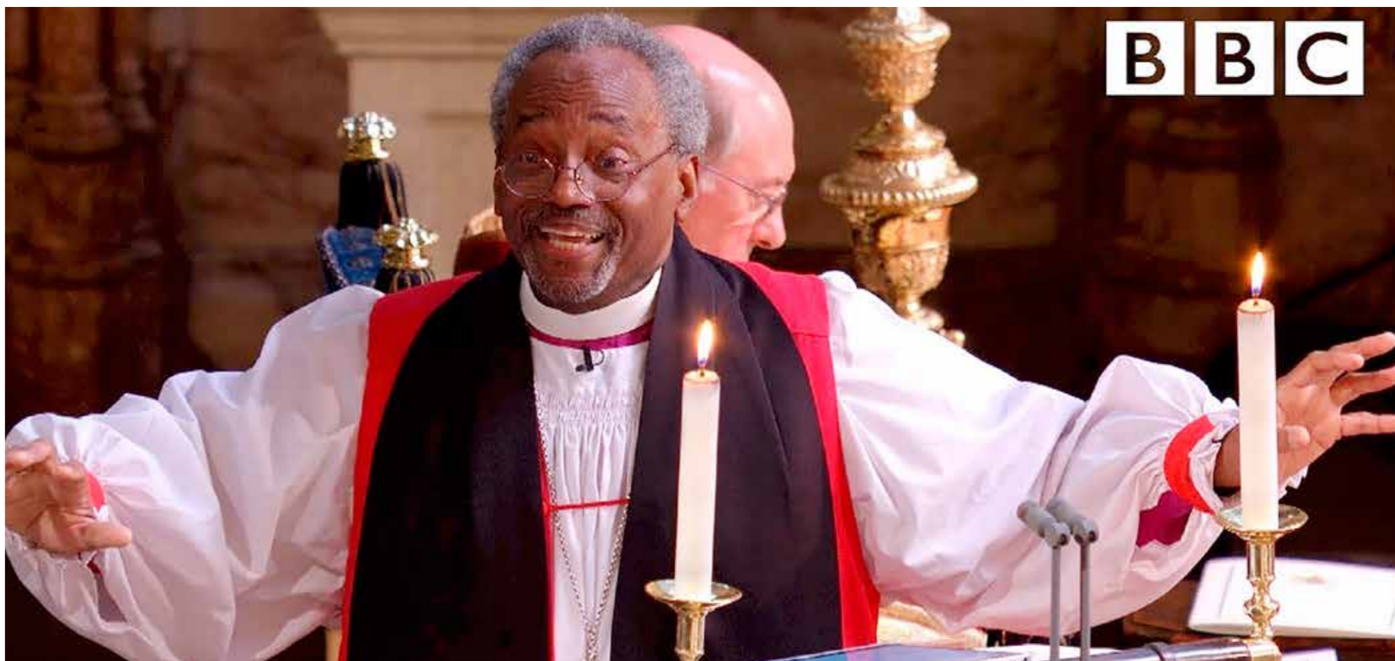
Skjermdump fra BBC's direktesending av prekenen

Det er et gammelt dikt fra middelalderen som sier at der sann kjærlighet finnes, der er Gud. Det nye testamente sier det på denne måten: «Mine kjære, la oss elske hverandre! For kjærligheten er fra Gud, og hver den