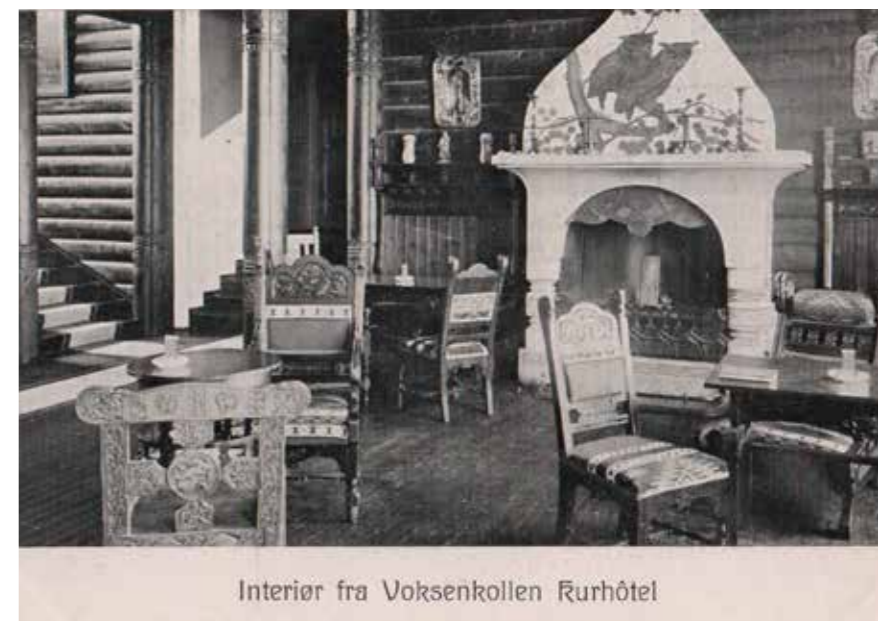
Ikke for "hvermannen". Her skulle man ta imot rikfolket fra hele Europa i fine og tradisjonsrike interiører.

I Holmenkollområdet ble det også bygget flere hoteller hvor rekreasjon var en viktig del av tilbudet på stedene. Vi kan her nevne Anne Kures Hotel på Voksenkollen, Eckbo's Legats Kursted i Jegerveien på Ris og Voksenkollen Hospits rett bak Holmenkollhoppet.