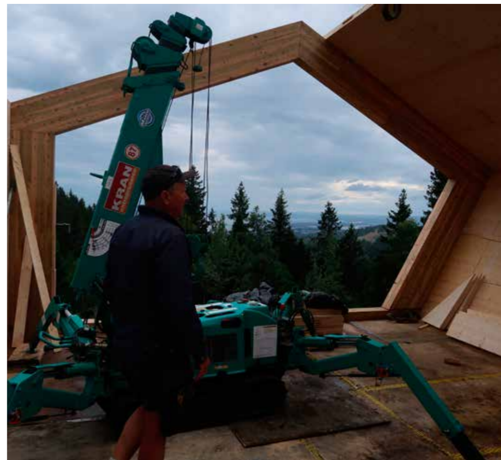
Fuglemyrhytta på Vettakollen under bygging, tegnet av Snøhetta-arkitekter.