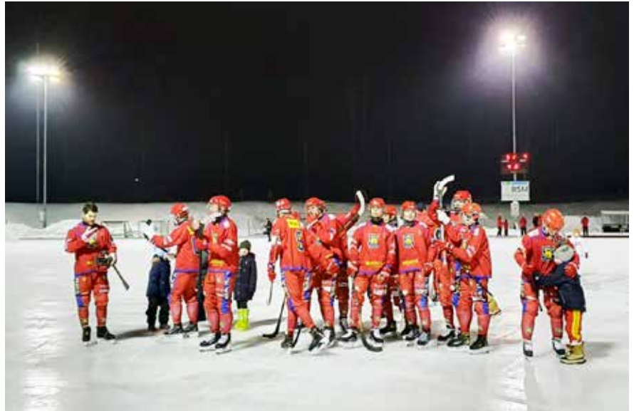
STOR JUBEL: Onsdag 8. februar sikret Røas bandylag videre plass i Eliteserien.

Har du lyst til å bli med i langrennsgruppa til Røa IL? Send mail til post@roail.no •