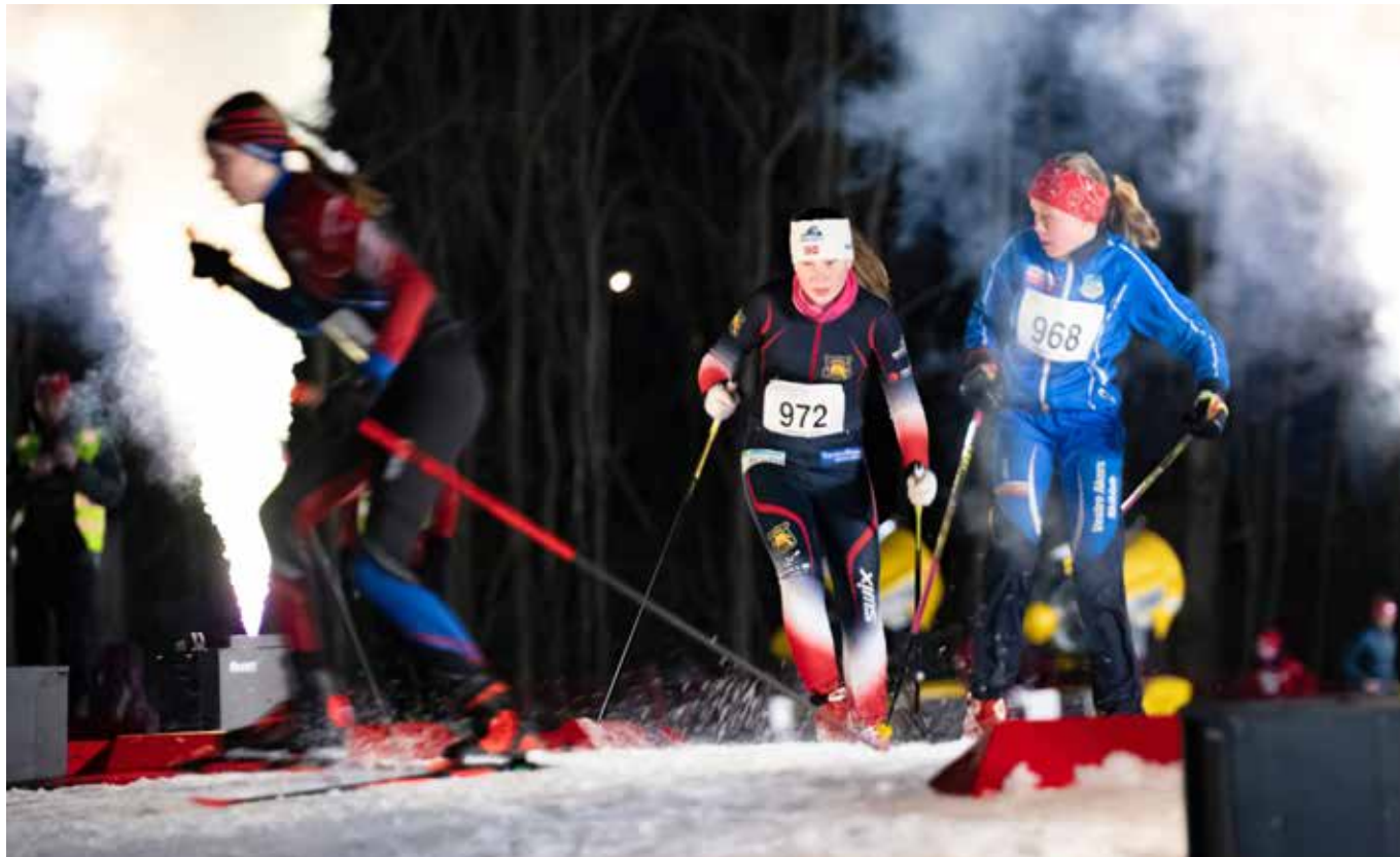
MARTINCROSSEN: Futt og fart på Røa Aktivitetspark Voksenjordet. Bildet er fra fjorårets arrangement.

Lek og trening går hånd i hånd i Røa. Et av de arrangementene som får mest medieoppmerksomhet er Martincrossen , som nettopp er gjennomført på Røa Aktivitetspark Voksenjordet. Dette ►