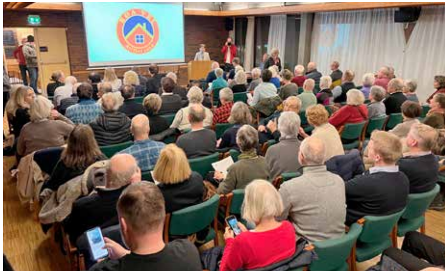
GOD OPPSLUTNING: Folkemøtet om sykkelstien i Nordengveien viste stort engasjement.

Den 8. februar arrangerte Røa Vel Folkemøte om forslag til sykkeltrasé i Norengveien. Bymiljøetaten (BYM) planlegger traséen på feil premisser, mener lokalbefolkningen.