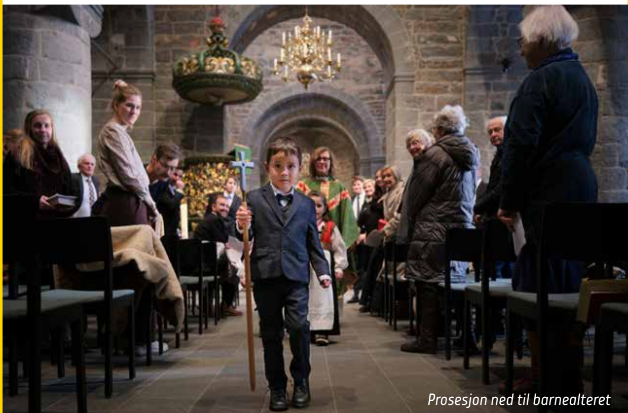
Prosesjon ned til barnealteret

Etter at vi har vært en stund i annerledesverdenen, så vender vi tilbake til den kjente virkeligheten, hvor alt er som før. Men vi er forandret, og vi ser verden med andre øyne. Barnealteret er ment å hjelpe barn til å oppleve samme undring og en