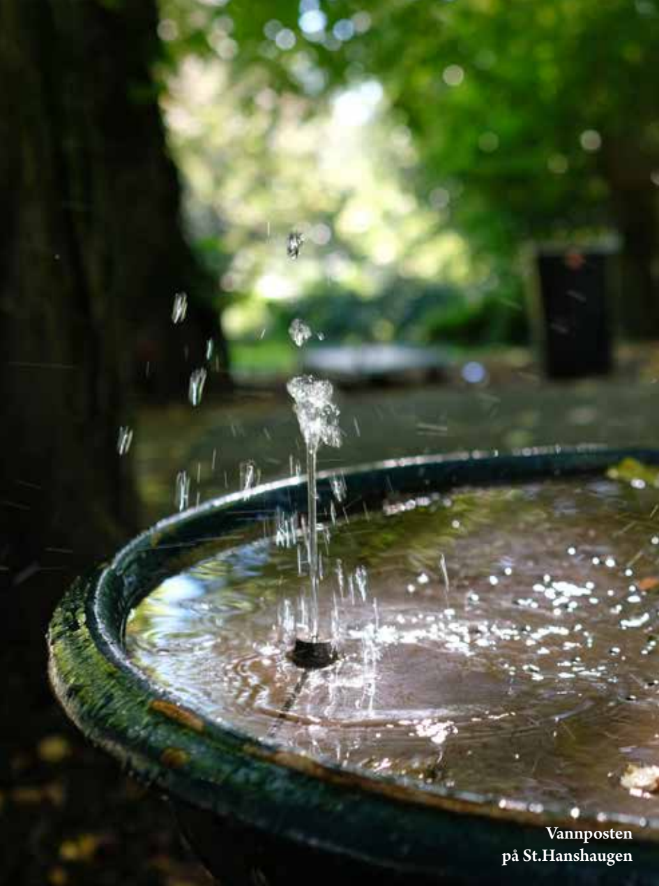
Vannposten på St.Hanshaugen