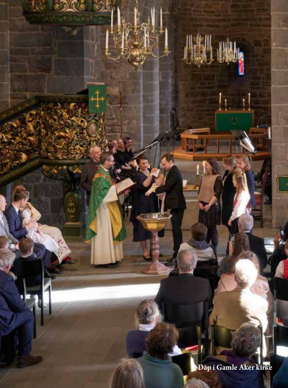
Dåp i Gamle Aker kirke