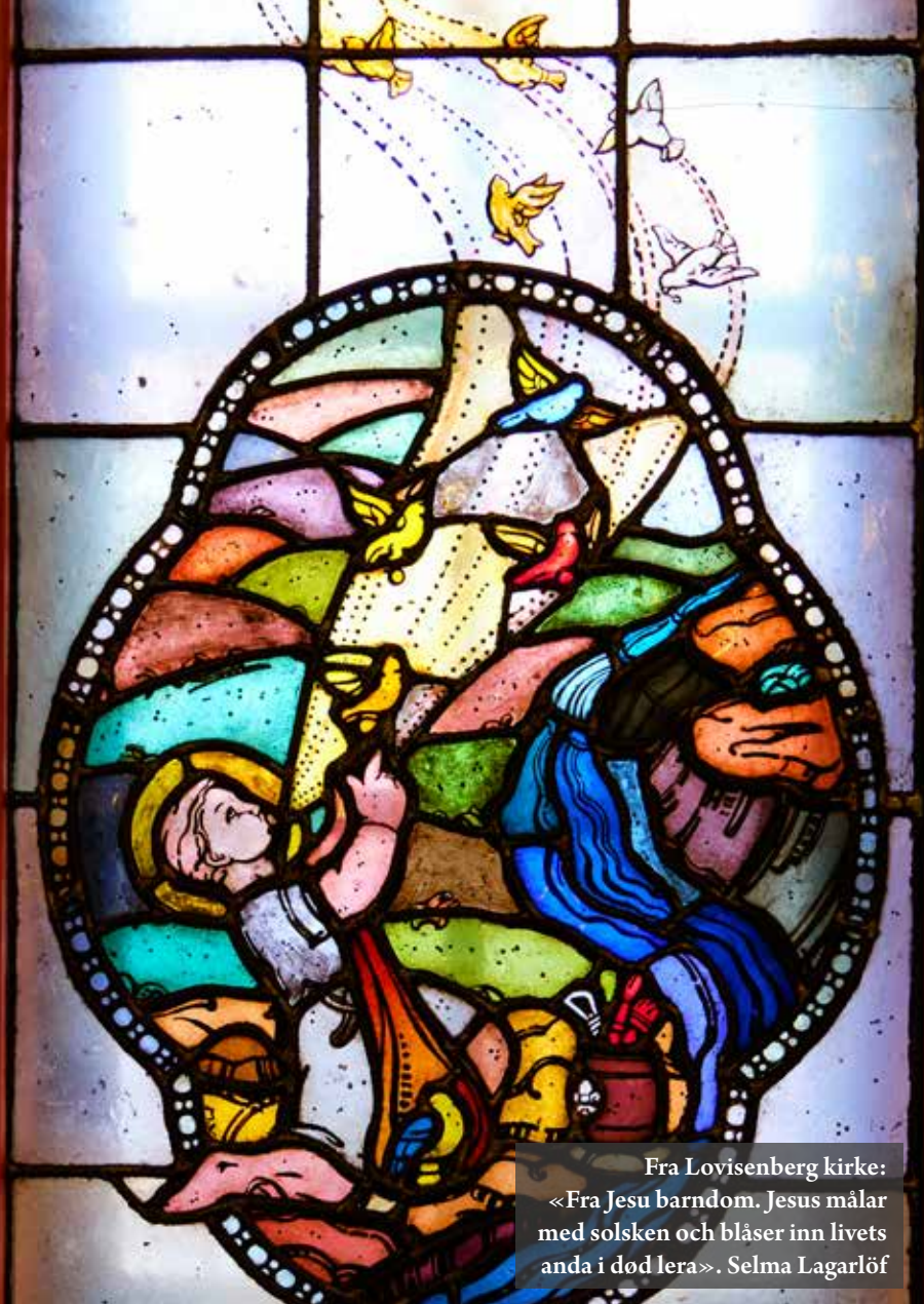
Fra Lovisenberg kirke: «Fra Jesu barndom. Jesus målar med solsken och blåser inn livets anda i dod lera». Selma Lagarlöf