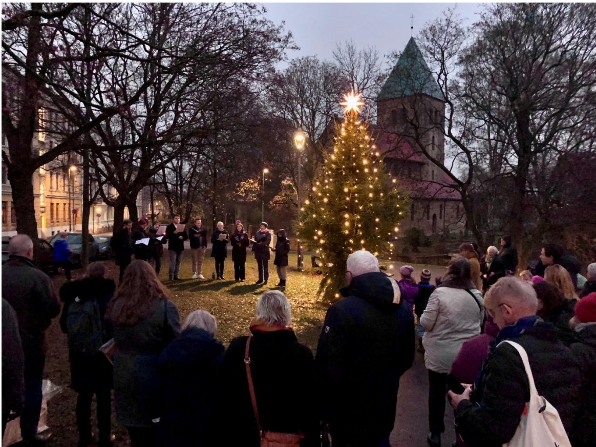
Bilde: Sangere fra Majorstua kammerkor synger ved juletretenningen, helgen første søndag i advent. Om lag 70 mennesker var samlet rundt juletreet.