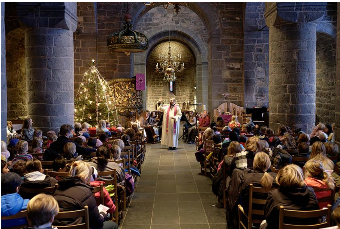
Bilde: fra "Jul i kirken" med Ila skole. Bak soknepresten sitter Ila og Bolteløkka skoles klarinettensamble som også deltok.