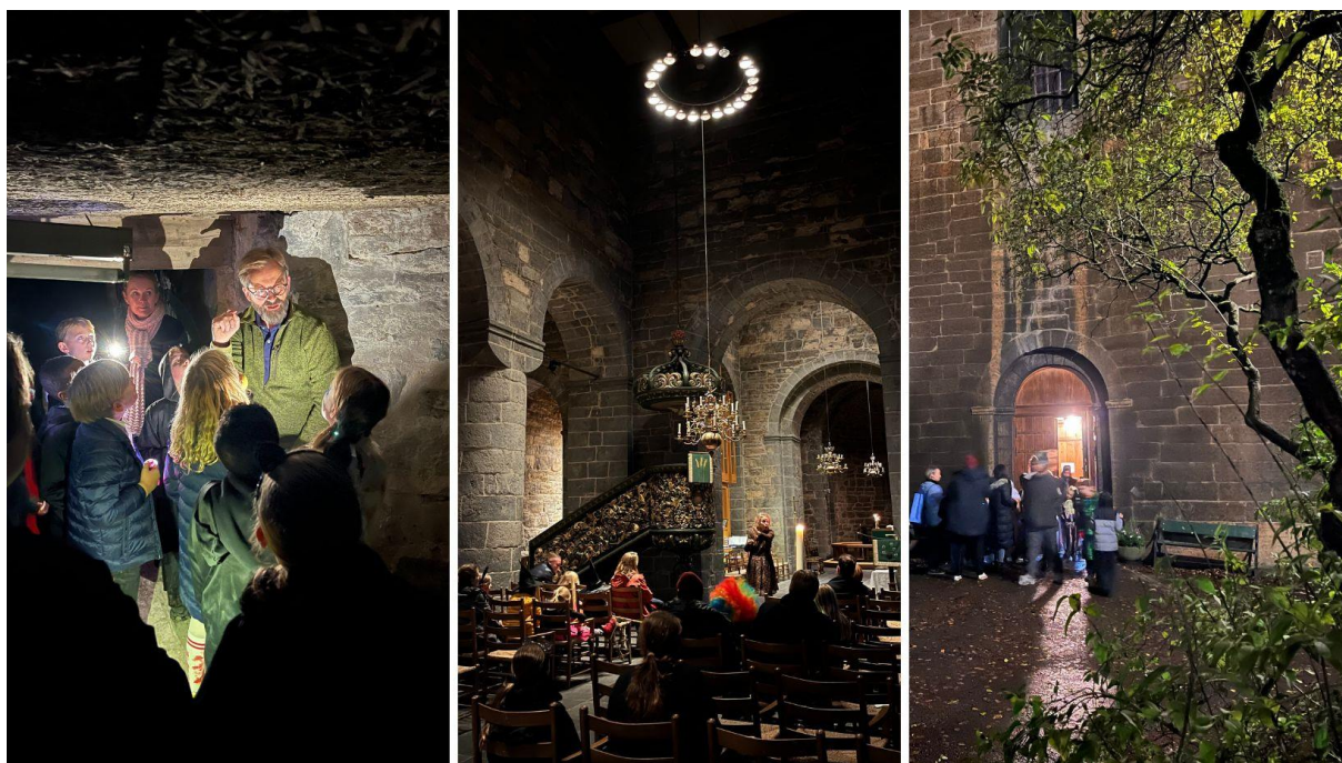
Bilder: Fra Halloweenfeiring i Gamle Aker kirke. Fortellerstund i krypten og helgenfortellinger i kirkerommet.

Det er også et spørsmål om vi får gjennomført Halloweenfeiringen i 2023 da Gamle Aker kirke er stengt også høsten 2023.