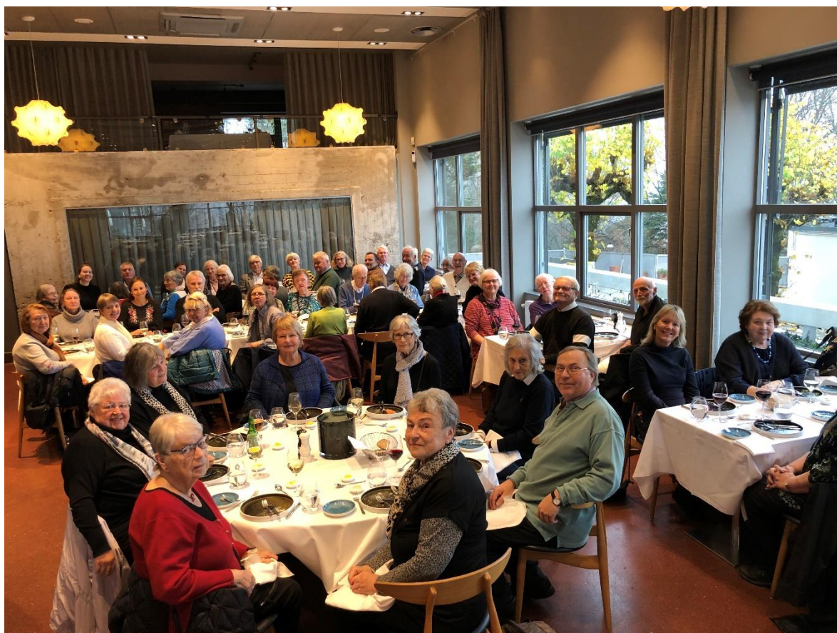
Bilde: Deltakere på tur med Langaas legat på Ekebergrestauranten

Utdelingen av juleblomster blir fremdeles meget godt mottatt. Og også i år fikk vi høre at vi var både ønsket og ventet, og det samme gjelder nok Fagerborgs diakon som klarer å kombinere blomsterutdelingen med et ordentlig besøk hos mottakeren.