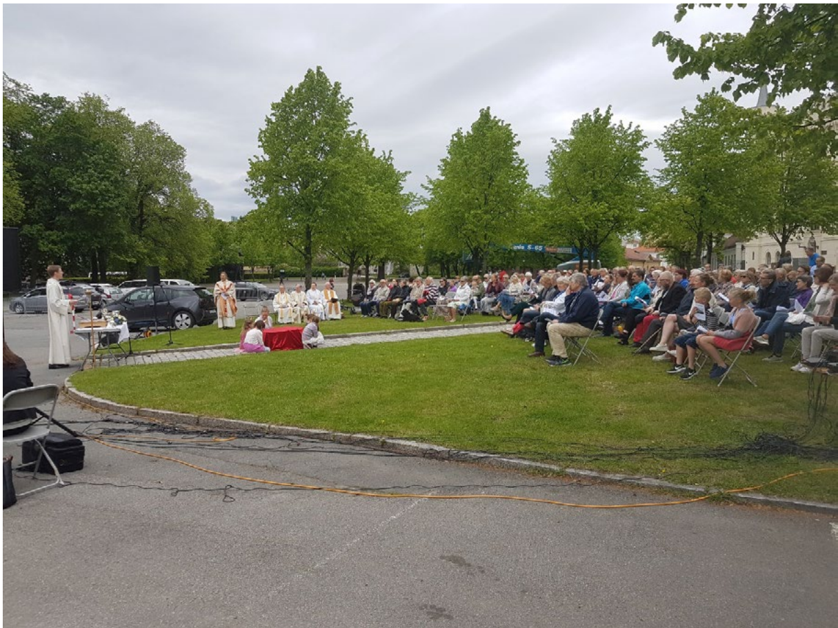
Det var behagelig overskyet under gudstjenesten, men under kirkekaffen dukket solen frem.