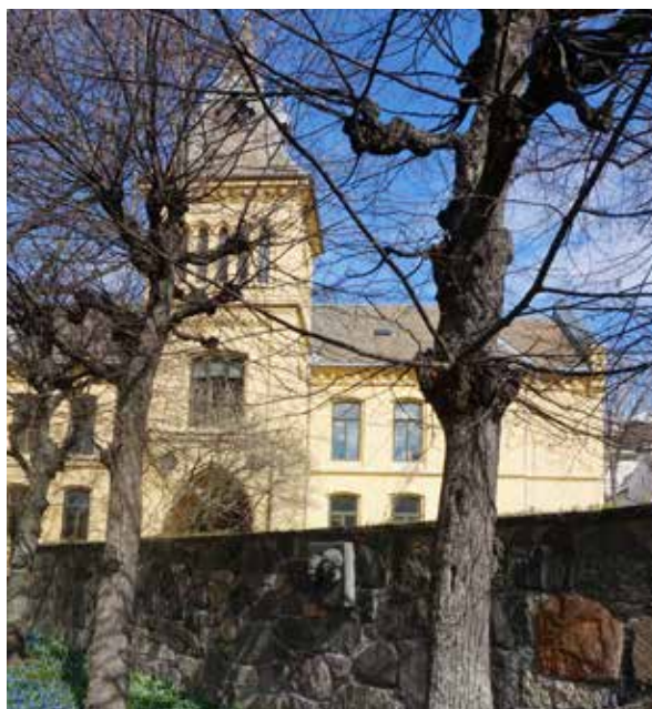
Det er vår i Oslo bispegård.