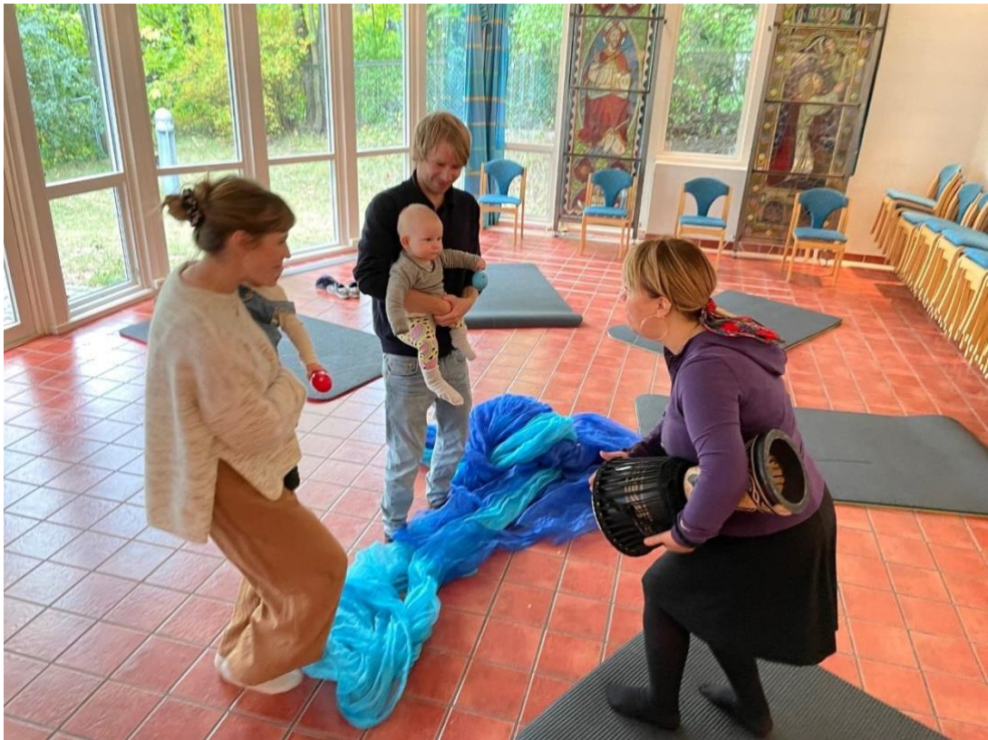
Babysang fungerer fortsatt som en god møteplass for foreldre og å videreføre sangtradisjonene våre.

før nedstengning. Det kan være flere grunner til dette: smittebekymring, tradering, informasjonsflyt mm. Antallet tok seg opp litt ilt semesteret og det har vært gode tilbakemeldinger på å ha babysangen i kirka.