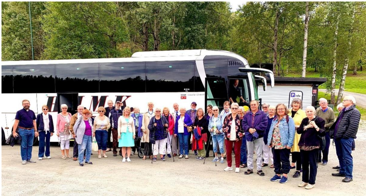
Sammen med Fagerborg menighet arrangerte vi tur for pensjonister til Blåfarveverket sommeren 2021.