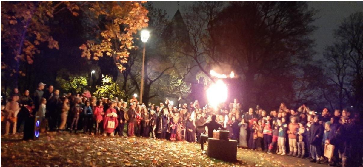
Halloweenfeiringa i Gamle Aker er kommet for å bli.

veldig bra. Det gikk rundt med støtte fra foreldre som både stilte frivillig til bakst på forhånd og til oppgaver i løpet av kvelden.