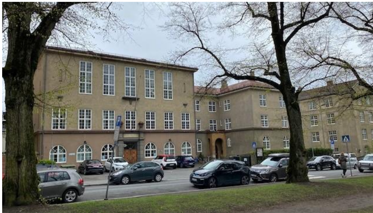
Vårt gamle menighetshus i Geitmyrsveien 7D ble solgt for 86 millioner kroner i 2021.

Den største saken i 2021 har vært salget av Geitmyrsveien 7D. Etter at MR hadde vedtatt salg på slutten av 2020, begynte arbeidet med selve salget. Juridisk ekspertise ble innhentet som hjelp til å velge mekler, og for å geleide oss gjennom salgsprosessen. Eiendommen ble lagt ut for salg på forsommeren. Det kom inn mange bud, men de fleste hadde forbehold knyttet til seg. Etter to runder ba menighetsrådet om bud uten forbehold. Da stod det igjen to bud, som ble behandlet på ekstraordinært menighetsrådsmøte den 4. oktober. Siden de to budene var likeverdige i forhold til den fremtidige bruken, valgte en det høyeste budet. Tilslaget gikk til Merkantilbygg Holding A/S for 86 millioner kroner. De hadde planer om å bruke eiendommen til eldreboliger med felles fasiliteter, på rent privat basis.