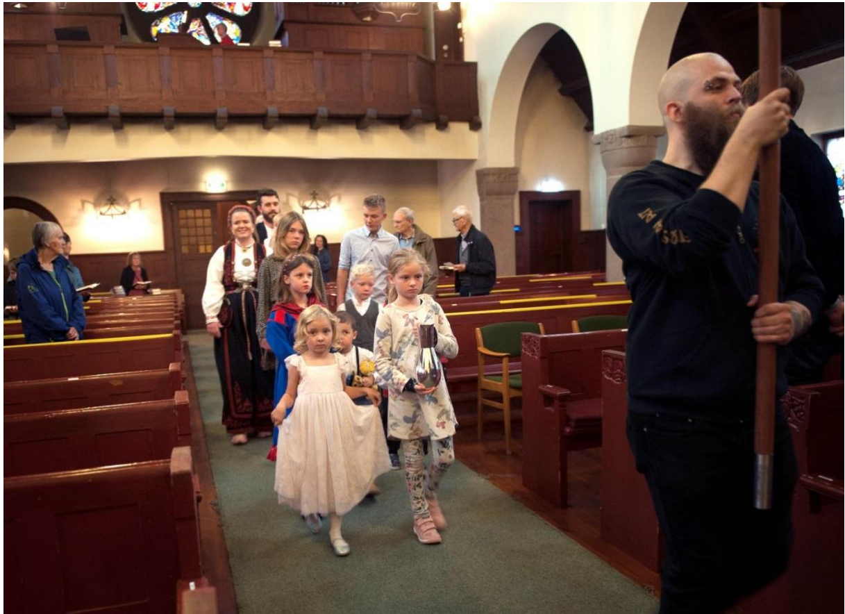
Prosesjon i forbindelse med dåpsgudstjeneste i Lovisenberg kirke.

Tradisjonelt feires gudstjeneste i fastetiden hver torsdag kl. 18.00, heller ikke det ble mulig å gjennomføre i 2021 som følge av pandemien.