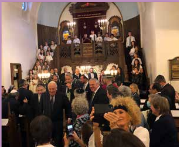
Fra 100-årsmarkeringen av synagogen, også St.Hanshaugen sokn var invitert og med på feiringen.

med davidsstjernen, er skremmende talende. Det samme er opinionsundersøkelser som viser at jødehatet er mer livskraftig enn vi liker å tenke på.