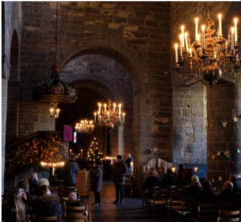
Bilde fra Gamle Aker kirke, julen 2020 – vi fikk ikke feire gudstjeneste grunnet korona, men ha åpen kirke med pålagt bruk av munnbind.