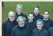
Sangere fra Consortium Vocale deltar