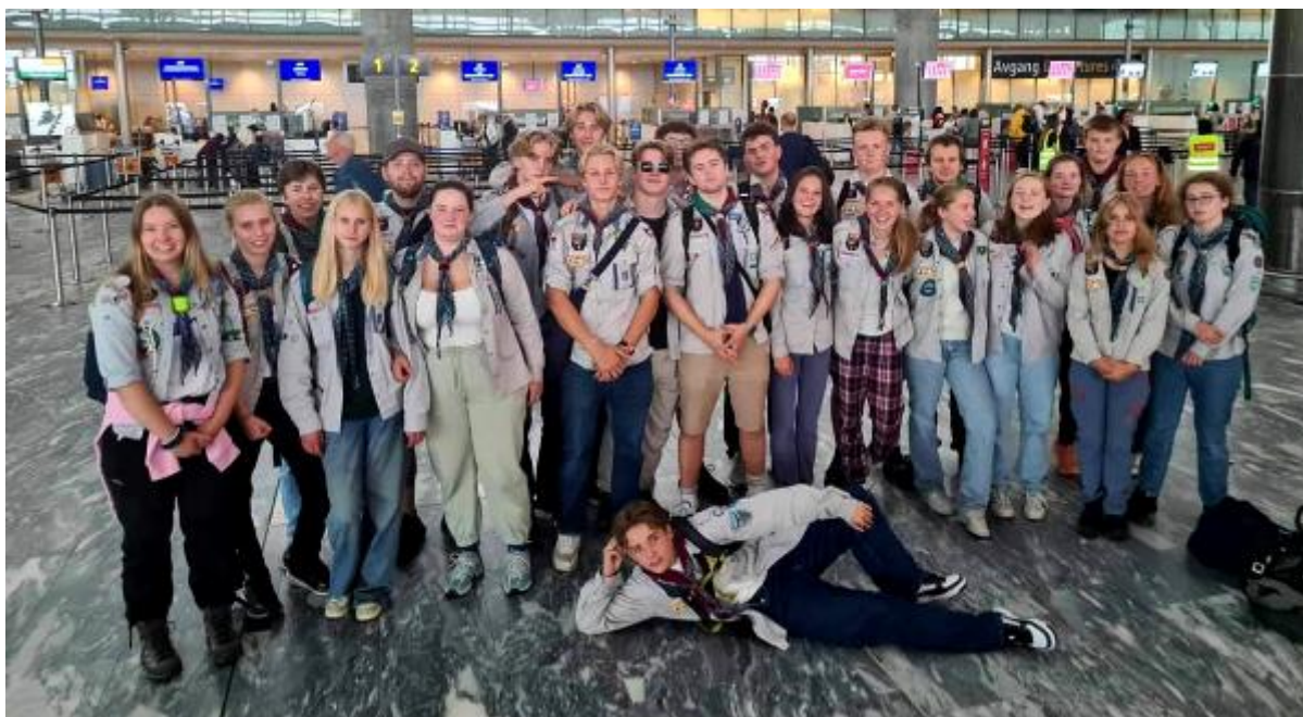
Bilde fra Gardermoen før avreise til Edinburgh, Skottland. Første stopp på Årets vandreretur til de Britiske øyer.

For mer informasjon, se Facebooksiden vår: https://www.facebook.com/7oslo