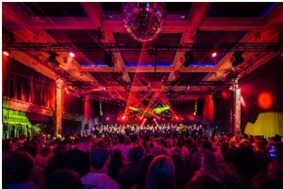
Foto: Fra klubbkonserter i Marmorsalen på Sentralen, fotograf Marius Dale (@madaoslo).

2023 har altså vært nok et svært innholdsrikt og vellykket år for Oslokoret. Koret holder et høyt musikalsk nivå, og har en fin balanse mellom nye talenter og sangere som har vært med en stund. Koret har gjennom året cirka 100 aktive medlemmer, og går 2024 i møte med mange kandidater på venteliste for opptak, så det lover godt for fremtiden.