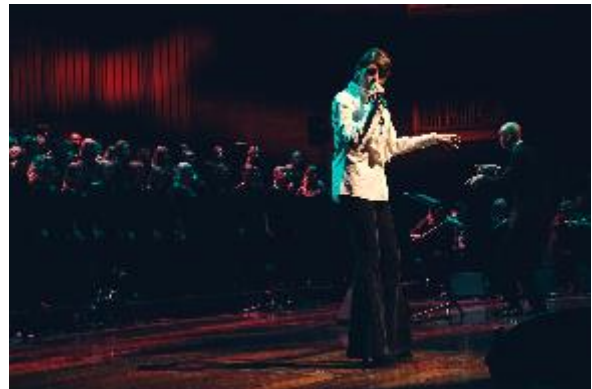
Foto: Fra førjulskonserter i Oslo konserthus