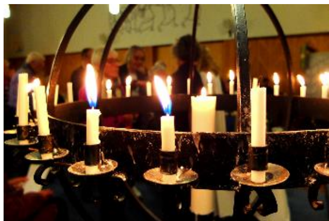
Keltisk kveldsbønn i november.

Planleggingsgruppen har fordelt arbeidsoppgavene seg i mellom, slik at alle gjør litt hver. Vi har gode rutiner og samarbeider godt. Samlingene gjøres kjent gjennom Tonsenbladet, menighetens nettside, Facebook og «munn til munn metoden».