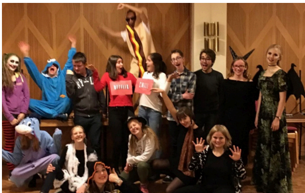
Bilde fra Halloween-øvelsen vår i oktober

2017 har vært et år der vi har gjort mye i tillegg til øvelser og konserter. Det blir for mye å nevne alt, men her har dere noen stikkord: Øvelseshelg i Larvik, Ten Sing-Norway-besøk, Globallop sammen med flere andre Ten Sing-grupper i Oslo-området, Spekter, Ten Sing-seminar, Hyttetur til vakre Lysern leirsted, Elvelangs, Musikk og mat, Halloween-øvelse, kretsøvelse og Pysj-cup. Med andre ord: Et innholdsrikt og godt år er vel gjennomført i TonSing!