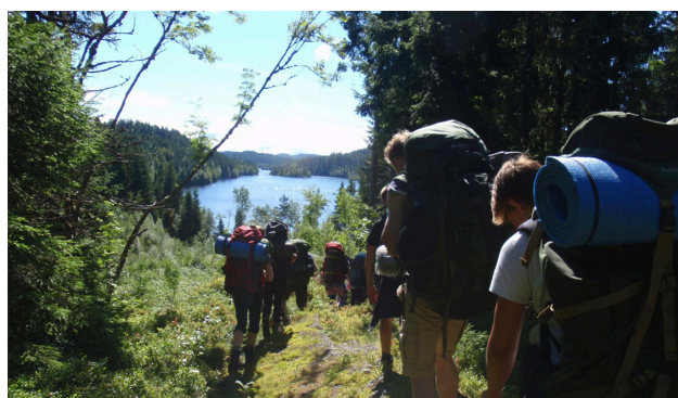
Bilde fra vandrersommertur for de eldste speiderne: